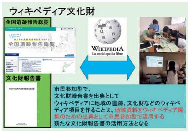
図4 ウィキペディア文化財の意義

るウィキペディアを入り口とした全国遺跡報告総覧の文化財資料へのアクセスの入り口が作れる。