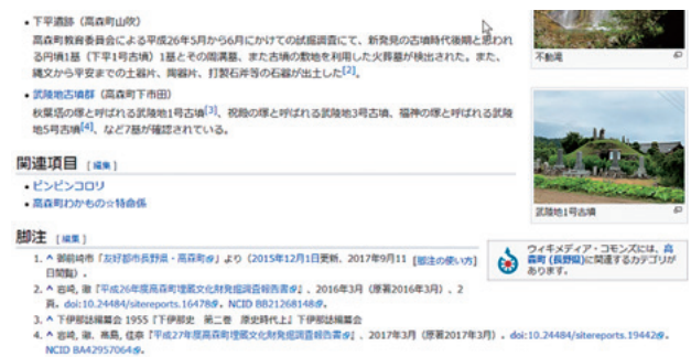
図6 ウィキペディア上の出典表記

よる地域の文化財情報発信を地域の博物館、郷土資料館を情報発信拠点として実現することが可能になる。