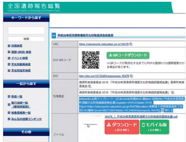
図5 Wikipedia出典テンプレート

このように、全国遺跡報告総覧の出典を付けたウィキペディア記事が増えることで、全国の文化財報告書を出典とした検証可能性が高く、より信頼されるウィキペディア記事増加の可能性が高くなる。また、多くの人に広く利用されているウィキペディアを入り口とした文化財報告書へのアクセス性の向上が可能となる。そして、このような全国遺跡報告総覧の書誌情報のウィキペディアテンプレート出力により、地域住民が自らの地域の文化財報告書の出典を明記した上で、その内容をウィキペディアに地域住民参加型で編集してもらうことで、地域住民に