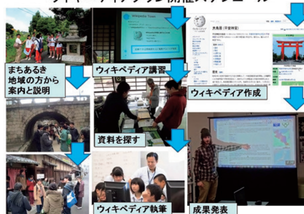
図1 ウィキペディアタウン開催スケジュール