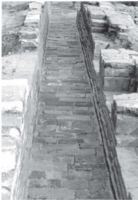
図2 南朝時期の磚組み排水溝