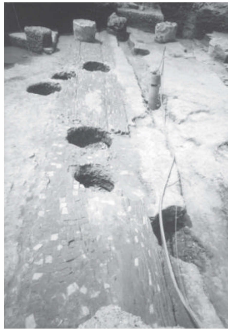
図4 新浦新世紀広場 東晋時期の磚道