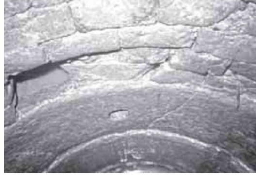
図3 南朝時期の磚組み井戸底部の水穴