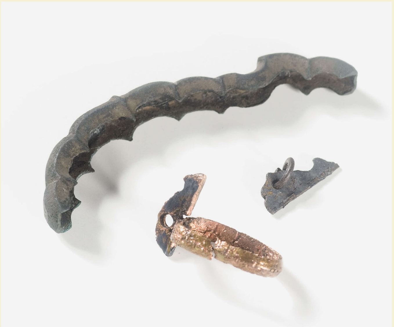
平城宮第32次調査出土の大刀山形足金物（左上）と刀子帯執金具（右下）、西大寺食堂院井戸出土の刀子帯執金具（左下）