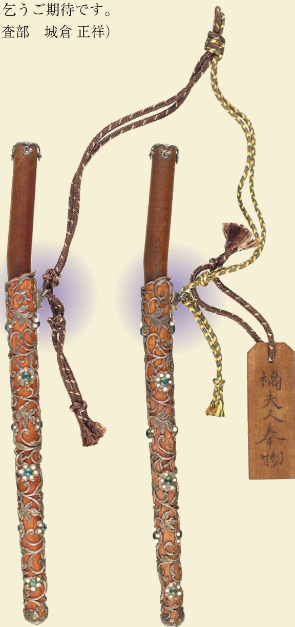
正倉院宝物 犀角把白銀葛形鞘珠玉荘刀子(全長18.8cm : S=2/3)