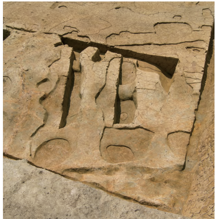
写真 3 建物跡 北から