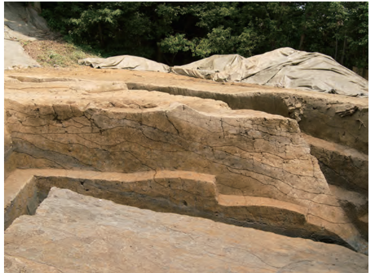
写真 2 谷の埋め立ての様子 南から