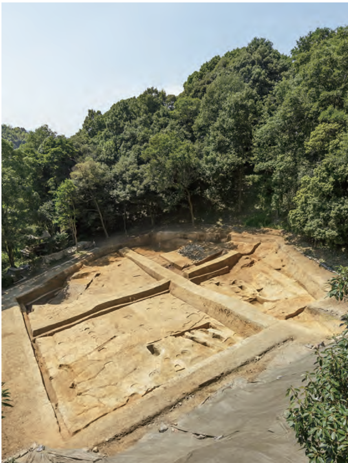
写真 1 調査区全景 北から