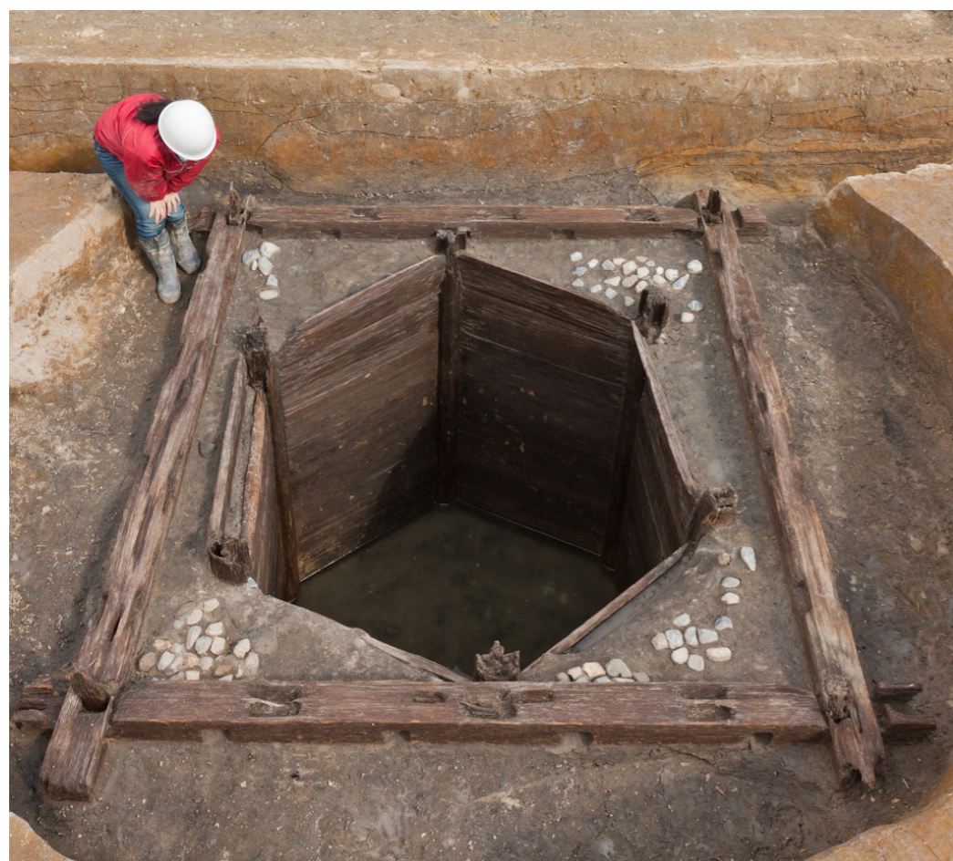
昨年度の調査で見つかった井戸

井戸のなかからは、木簡や土器、瓦が出土しました。なかでも注目されるのは文書の軸です。この木口部分に、天平2年(730)の年紀が記してありました。井戸の埋没は出土した土器や瓦の年代から、奈良時代の中頃とみられます。土器は須恵器の壺や食器類、土師器の杯皿などが含まれていました。とくにめだつて多いのは煮炊きに使われた土師器の甕です。その他、須恵器の壺類が多く含まれていました。陶硯や奈良三彩も小片ながら出土し、「右相撲□」、「□撲司」などと記した墨書土器も出土しました。これらの遺物から、奈良時代の前半期に井戸の周りには、公的な機関が存在していたと思われる。今回、井戸の西では工房等が見つかり、これに該当する建物群がないことが確認されましたので、東側に展開する可能性が高くなりました。