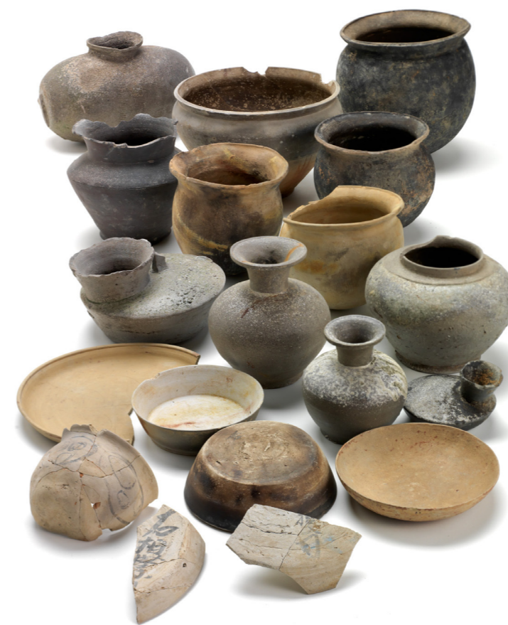
井戸から出土した土器

井戸のなかからは、木簡や土器、瓦が出土しました。なかでも注目されるのは文書の軸です。この木口部分に、天平2年(730)の年紀が記してありました。井戸の埋没は出土した土器や瓦の年代から、奈良時代の中頃とみられます。土器は須恵器の壺や食器類、土師器の杯皿などが含まれていました。とくにめだつて多いのは煮炊きに使われた土師器の甕です。その他、須恵器の壺類が多く含まれていました。陶硯や奈良三彩も小片ながら出土し、「右相撲□」、「□撲司」などと記した墨書土器も出土しました。これらの遺物から、奈良時代の前半期に井戸の周りには、公的な機関が存在していたと思われる。今回、井戸の西では工房等が見つかり、これに該当する建物群がないことが確認されましたので、東側に展開する可能性が高くなりました。