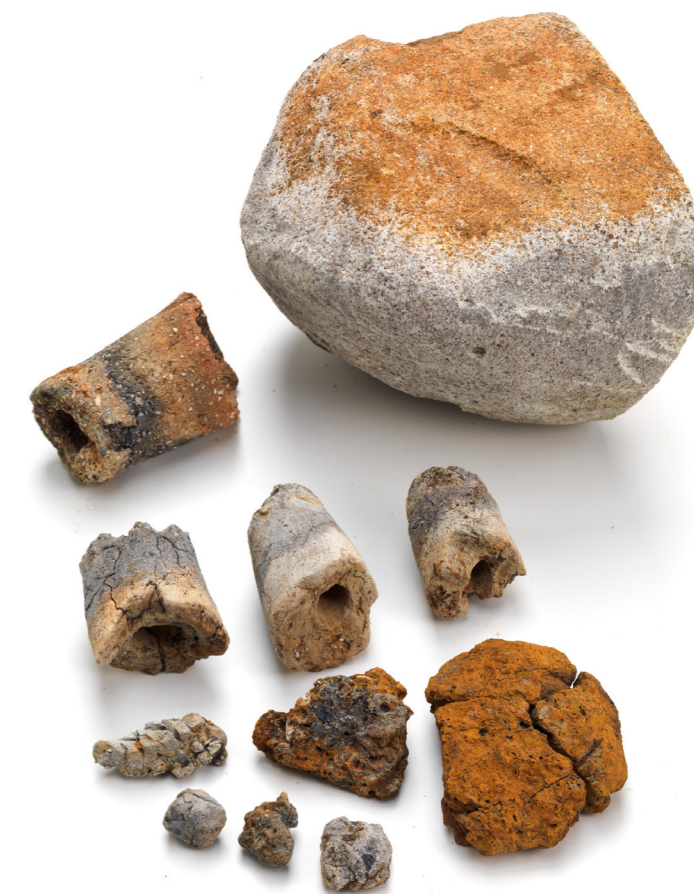
工房から出土した鉄滓・羽口・金床石

工房の近くでは、大量の炭を使っていたため、炭を含む真っ黒な土が一面に広がっていました。工房付近の溝や土坑につまった土には、木炭とともに工房に関連する遺物が入っていました。なかでも多いのが、炉に風を送る「ふいご」の先に取り付ける羽口です。現時点で70～80点を数え、まだまだ増えると予想されます。また、鉄を鍛造加工するときに出る鉄滓も多量に含まれていました。この鉄滓のタイプと、炉の大きさなどから、小型の鉄製品を鍛造で加工していたことが推定されます。工具ならば斧など、建築部材ならば釘など、武器ならば鉄鎌などを作っていたと推定されます。鉄製品の出土はきわめて少ないですが、鉄釘が1点確認できました。その他、金床石と呼ばれる赤熱した鉄を叩く台に使われた石が10数点、砥石が1点確認できています。