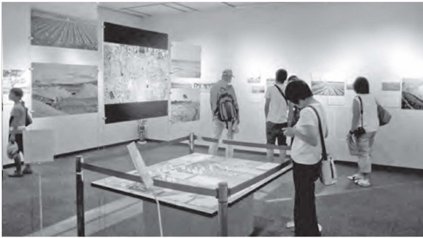
図4 夏期企画展のようす

は、レプリカにはない魅力を持っている。そこで遺物展示コーナー（図2）には、当研究所の発掘調査で出土した遺物を展示した。また官衙・宮殿コーナーでは、ジオラマの中に関連遺物を展示し、対比できるようにした。 ④奈文研管轄の資料館としての特色を出す：「奈文研ならではの資料館」を意識し、他の歴史系博物館・資料館との差別化をはかるため、遺物展示コーナーに研究室コーナーを設けた。ここでは、遺物を歴史のテーマや内容に沿って展示するのではなく、木簡や木器・金属器、土器や瓦、各々の研究室が遺物をどのような視点で分析し研究しているのか、実際の遺物を交えて解説した。