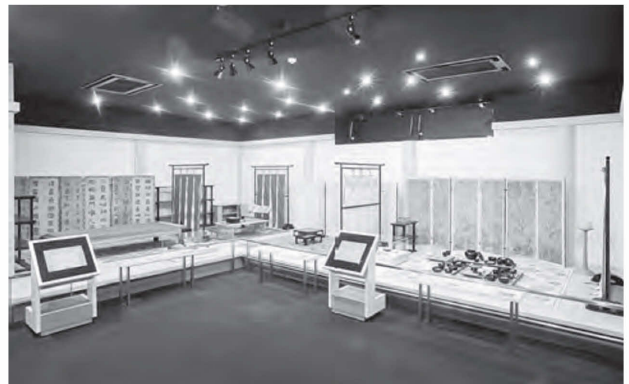
図1 宮殿復原展示コーナー