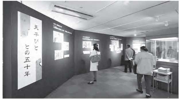
図5 秋期特別展のようす

当企画展は展示内容から地元の方々に是非ご来場いただきたいと考え、都跡地区の自治連合会長のご協力を得て、近隣町内の回覧板で各世帯にチラシを配布していただいた。また企画展終了後、都跡小学校の創立100周年の催しとして小学校で写真パネルの一部が展示された。こうした地元とのつながりも、今後大切にしていかな