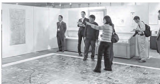
図6 冬期企画展のようす

在住地 夏期企画展では、関東地方(特に東京)からの来訪者が近畿地方を上回っている。秋期になると、関西圏