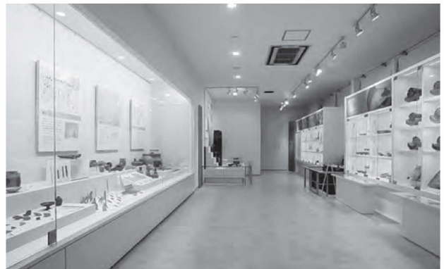
図2 遺物展示コーナー

にした調度を置いた(図1)。解説文は平城宮の概略紹介に努め、難解な専門用語や複雑な詳細内容は避けた。