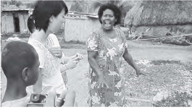
図19 村落にて住民から聞き取り調査をおこなう