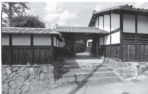
図24 明治期の茶工場 (No.1 H家旧茶工場)