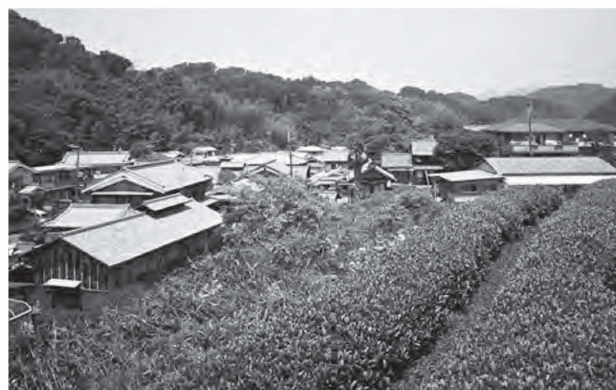
図25 茶畑が広がる白川地区の集落景観