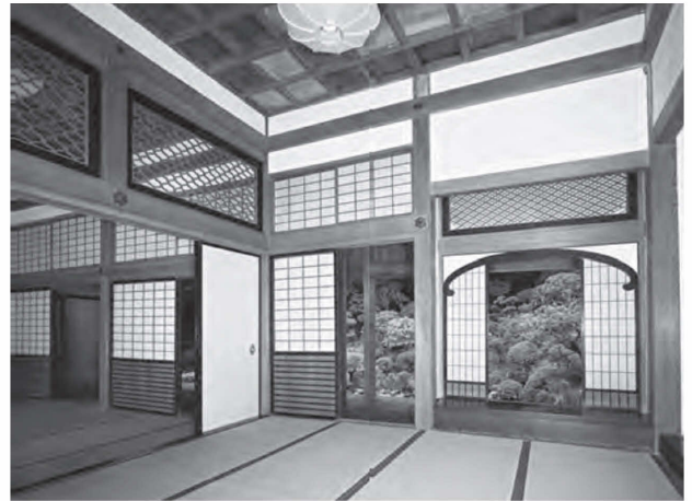
図36 竹林寺客殿 上段の間（北東から）

の部屋北面の柱間装置の変更（土壁→引違戸）、小玄関東面北側の柱間装置の変更（土壁撤去）、小玄関と背面8畳との境の柱間装置の変更（土壁→引違戸）、小玄関東部で南方に突出する部分などが改造された点である。