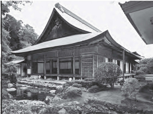
図35 竹林寺客殿 正側面（南西から）