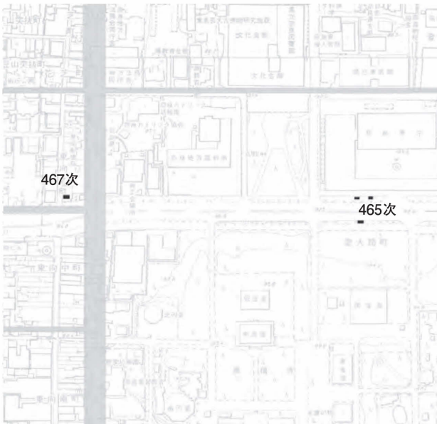
図229 第465次・467次調査区位置図 1:6000

上から近・現代の造成土（厚さ約65cm）、茶褐色土（約60cm）、灰褐色土（約40cm）、黒褐色土（約10cm）、灰黄褐色土（約25cm）、黄褐色土（地山）の順である。