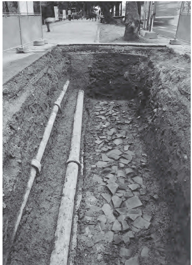
図230 灰褐色土上面瓦堆積（東から）

SX9463 調査区西壁の土層断面で、SD9460の北側に検出した掘込地業。地山を約20cm削り込み、人頭大の石を入れて埋め戻している。南端から1.2m分が確認でき、北はさらに調査区外に続く。上層には、築地塀が存在した可能性がある。