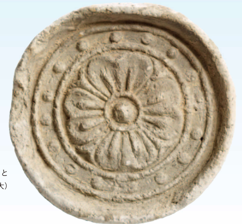
平城京で出土した最大の軒丸瓦(左)と 最小の軒丸瓦(右)(原寸大)