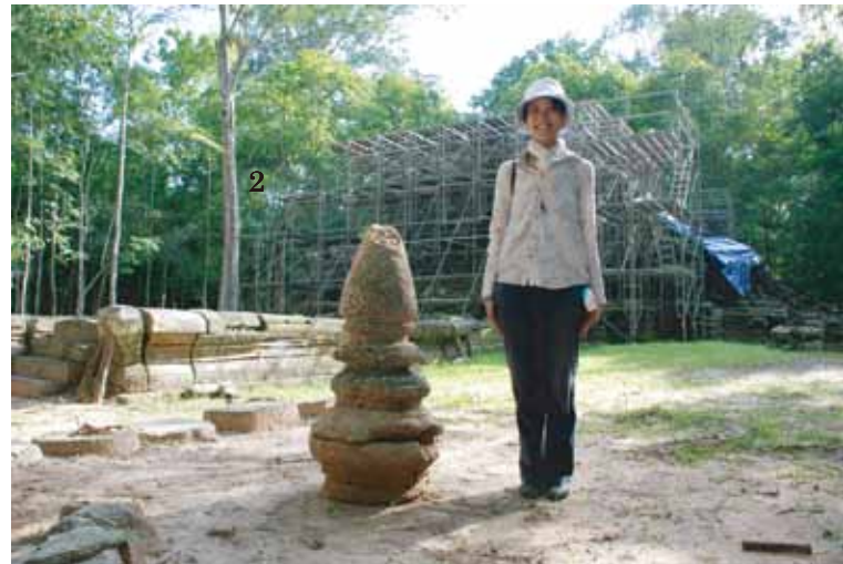
遺跡周辺から見つかった「宝珠」石材 Top ornament of small stupa found around the site