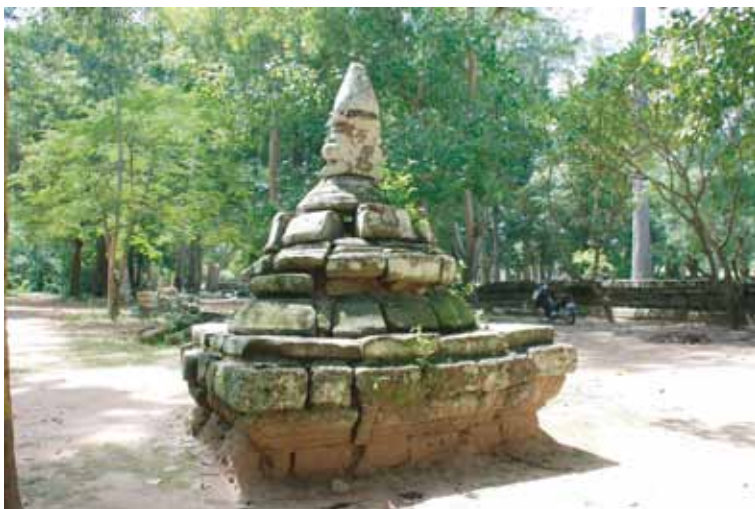
アンコール・トム内に現存する小ストウパーの一例 An existing example of small stupa in Angkor Thom