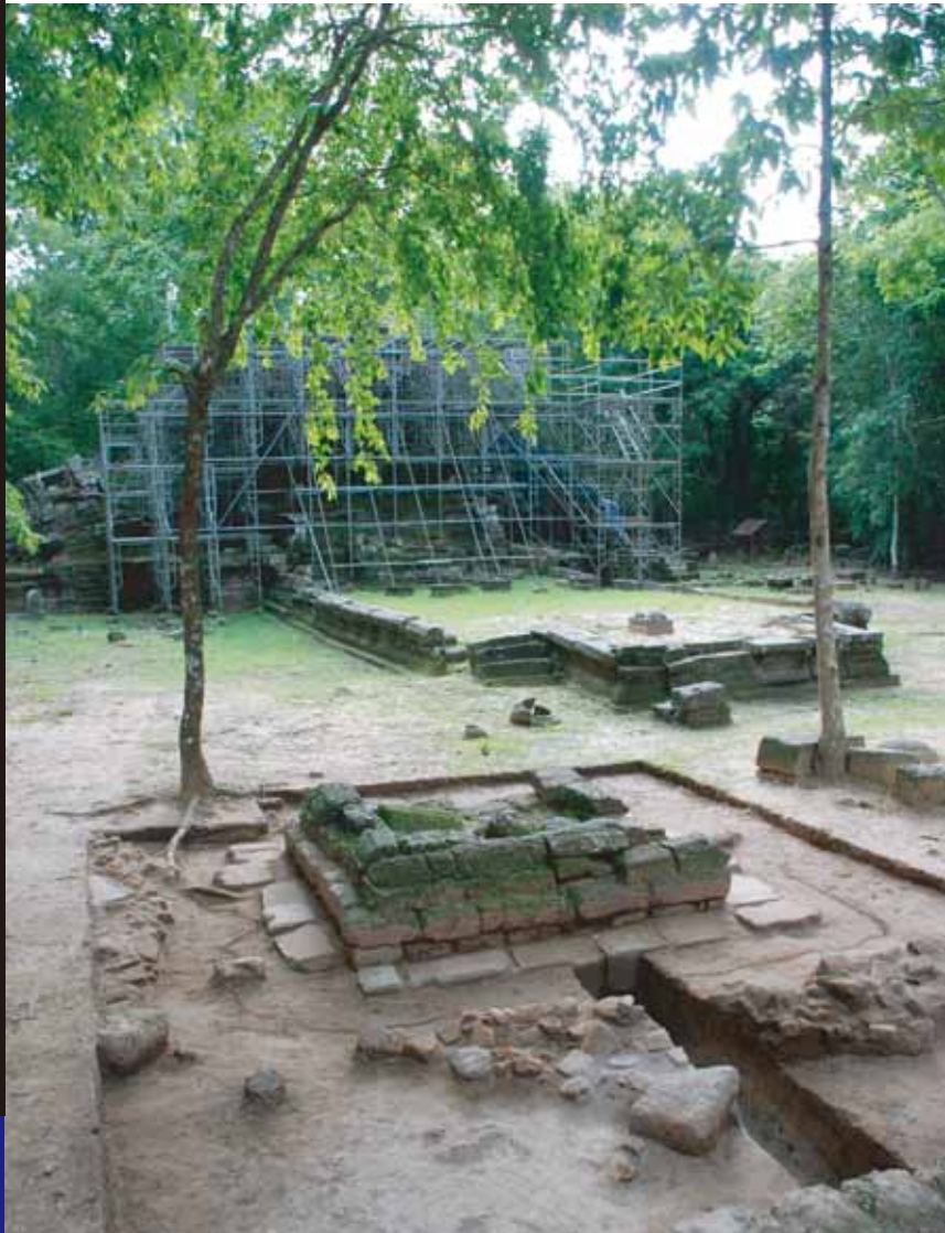
第10次調査の発掘区（東から）

奥に足場がかけられた寺院中心部をのぞむ An overview of excavated area (from the east) In the back is the main buildings of the site with scaffoldings.