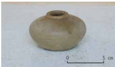
出土したタイ・スワンカロク産の石灰壺 14世紀前半頃のものとして推定される。スワンカロク産の陶器は日本でも「宋胡録(すんころく)」として知られており、当時広い範囲で流通していた。