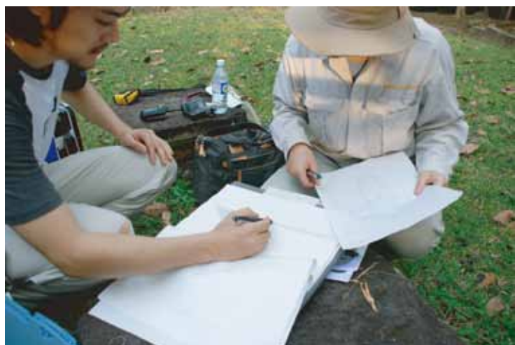
作業風景 Researchers at work

発掘調査と並行して、西トップ寺院では建築学的な調査も継続的に実施されています。本年度では 2009 年 12 月、2010 年 2 月に調査を実施しました。この調査では崩れかかっている建造物の現状を詳細に記録することが目的で、最終的には平面図・立面図といった実測図を作成することとなります。こうして作成された図面は、今後この遺跡を整備していく上での基礎的な資料となります。本調査では同時に、建物の構造的特徴や、建築的もしくは美術的意匠についても検討がなされています。これまでのところ、中央祠堂、南北小塔、仏教テラスのいずれも建築仕様が異なり、何度も増改築がおこなわれたことが明らかになりました。