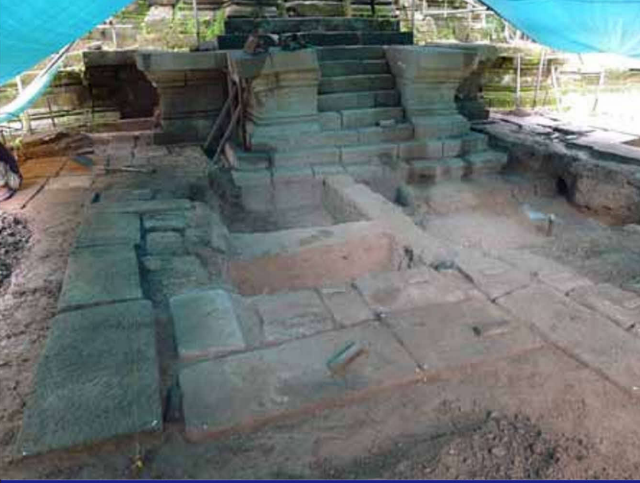
最下部の一段の石材を残して解体が完了した南祠堂

Dismantled Southern Sanctuary beside the lowest stones