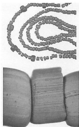
図3 (上) 小さな玉は赤褐色小玉、大きな玉は青～紫紺色小玉。(下) 赤褐色小玉拡大写真

風化に対する抵抗は大きく、耐水性が向上している。このタイプのガラスは、Mutisalahと言われ、インドが起源でインドネシア・フィリピンから東アジアなど広範囲に分布しており、海上ルートによる交易を示していると言われている。いっぽう、青紺～紫紺色小玉については「琥珀蛋白