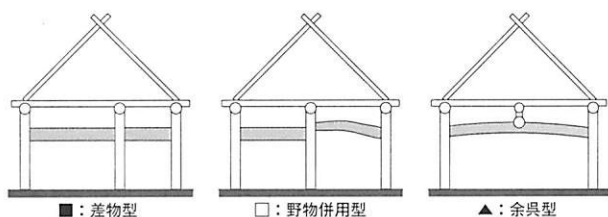
図2 滋賀県近世農家の架構形式

差物型 （分布図：■） 土間境において、内法の位置に差物だけを用いる架構形式であり、近畿地方全域に広く分布する。滋賀県における差物型の分布域は東海道および中山道の街道沿いに集中している。この分布域からみて、差物型は周辺の近隣地域で成立し、時代が下るとともに街道を通じて滋賀県に伝播し、図3のような分布を示すに至った可能性を想定できる。これは、三重・京都・大阪・奈良に分布する整形四間取りおよび食い違い三間取りの架構形式がすべて差物型であることから裏付けられる。さらに、滋賀県における差物型の平面が、近隣諸地域と同じく、ほとんど整形四間取りであることも傍証となろう。