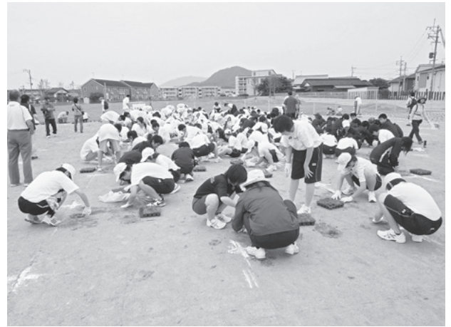
図2. 市民の手で行われた張芝作業

保存活用」とは、史跡整備の方向性として「市民による手作り整備」を進めることを意味している。市民の力により保存が実現した遺跡として、将来にわたりともに守り育てていく姿勢を明確にしたものであり、進行中である整備工事においても、多くの市民が芝張りや植栽を行っている。また、今後は復元建物も市民の手で建設される予定で、茅の栽培も含めた屋根の葺き替えなど、具体的な維持管理の手法も提案され、地域住民のよりどころとなりつつある。