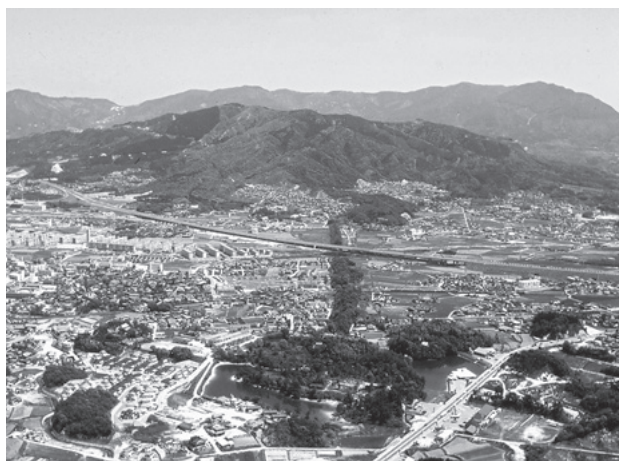
図3. 特別史跡水城跡