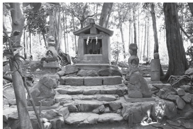
図4. 山頂に鎮座する祠と宋風獅子・薩摩塔

平成25年(2013)3月に指定された首羅山遺跡は、中国系石造物の遺存や高級な貿易陶磁器の出土、宋に渡った禅僧悟空敬念の入山記録など、大陸色豊かな中世の山林寺院である。博多湾周辺には、日本古来の山林寺院の流れを受け継ぐ要素と、国際貿易都市博多を通じてもたらされた大陸的な要素が混在する寺院がいくつかある。その中であって、首羅山遺跡は15世紀前半に廃絶後、