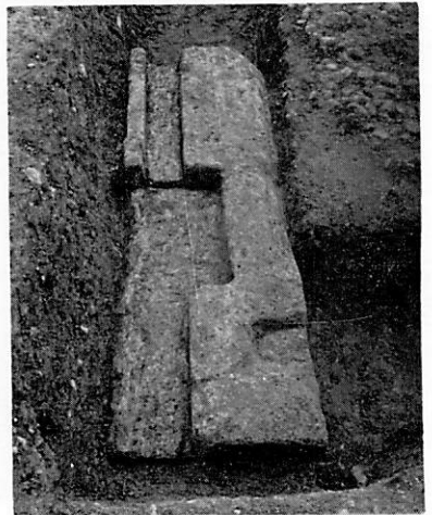
凝灰岩地覆石 (北面東階段西入隅部)

上層遺構 下層建物廃絶後に造営された基壇建物とそれに付随する諸遺構である。S B 9150 は東西 46.0m (155 天平尺)、南北 23.8m (80 尺) の凝灰岩壇正積基壇の上に建つ礎石建物で、桁行 9 間 (129 尺)、梁行 4 間 (54 尺)、四面廂付の東西棟である。柱間寸法は身舎 15 尺等間、廂の出が 12 尺で側柱心からの基壇の出は 13 尺である。基壇の残存状態は良好で、礎石は残っていないがその据付位置を全て確認することができた。階段は南面では中央間とその東西の 3 間目の 3 ケ所に設けられる。北面も同様に南面と対応する位置にあるが、中央階段には大極殿後殿に連なる軒廊 S C 9144 B の基壇 (幅 8.15m) が取り付く。軒廊基壇には大極殿基壇北端から北約 3.3m (11 尺) に梁行柱間寸法 4.5m (15 尺) の一対の礎石抜取痕跡がある。軒廊は当初幅 3.8m であったものを後に拡張している。階段幅は 4.45m (15 尺)、出は 3.55m (12 尺) である。東・西面では後述する足場 S X 9148 の柱位置の状況から、南から 2 間目の位置に各 1 ケ所の階段を設けていたと推定される。S D 9143 は地覆石の抜取痕跡で、幅 60cm 前後、深さ 30cm の溝状を呈する。同遺構は基壇北側では残存状態が良好で、西・南側でも部分的に確認した。北面東階段の西入隅部分には凝灰岩地覆石が 2 点、東西方向に相接して原位置に残存していた。上面には羽目石および東石を受ける継ぎ合せ仕口が明瞭に残る。基壇周囲には前後 2 時期にわたって石敷が敷設される。当初直径 1cm 前後の小礫敷 S X 9145A であったものを後に嵩上げして直径 5 ~ 15cm の礫を敷き詰めた小石敷 S X 9145B に改修している。石敷遺構は基壇北側で検出したもので、東・西・南側では後世の削平のため残っていない。基壇中央部分を南北方向に断ち割り次のような基壇築成工程を明らかにした。(1)南に緩やかに傾斜する下層整地地面上に、まず一まわり小規模な土壇① (南北 20.5m、東西約 41.9m) を築成する。この上面は水平面であるので高さは北で 75cm、南で 120cm を測る。積土には下半部に小礫を多く含む暗褐色粘質土を多用し、上半部には精良な明黄褐色粘質土を用いており、厚さ 2 ~ 10cm の版築層が 15 ~ 16 層数えられる。(2)土壇①の上面の礎石据付位置に基底部での直径 2.7 ~ 3.2m、高さ 0.50 ~ 0.55m (復原値) の円丘形の盛土②を行なう。円丘の基底部に厚さ 2 ~ 5cm の固く締った層を凸レンズ状に 2 ~ 3 層積上げた後、厚く粘質土を盛るもの (北側柱位置) と土壇①の上面を 30cm 程椀底状に掘り下げてから粘