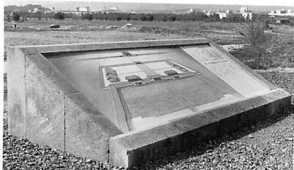
説明板（第1次大極殿跡）

宮の建物からイメージされる朱塗りの柱と白壁をモチーフとするデザインとし、白壁の部分に行先を明示した陶板をコンクリート躯体の上にモルタル接着した。