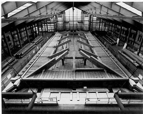
朱雀門復原工事（二重の組物まで組立完了）

園池北方地区の整備 園池北方地区では、板塀復原工事・地形復原造成・導排水関連工事・植栽等を実施した。復原した東西方向の板塀（第110次調査で検出した掘立柱東西塀SA9064）は、庭園の北を