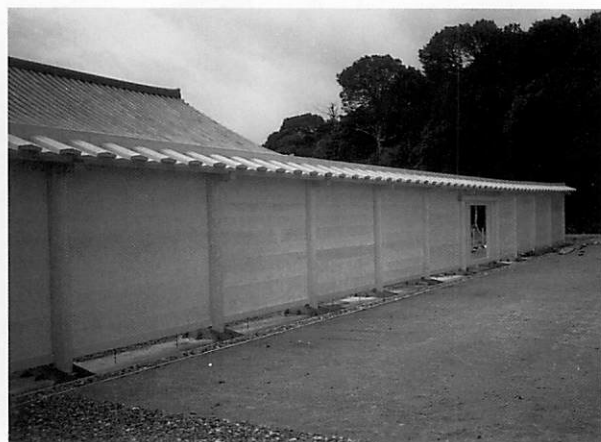
東院園池北方地区 板塀