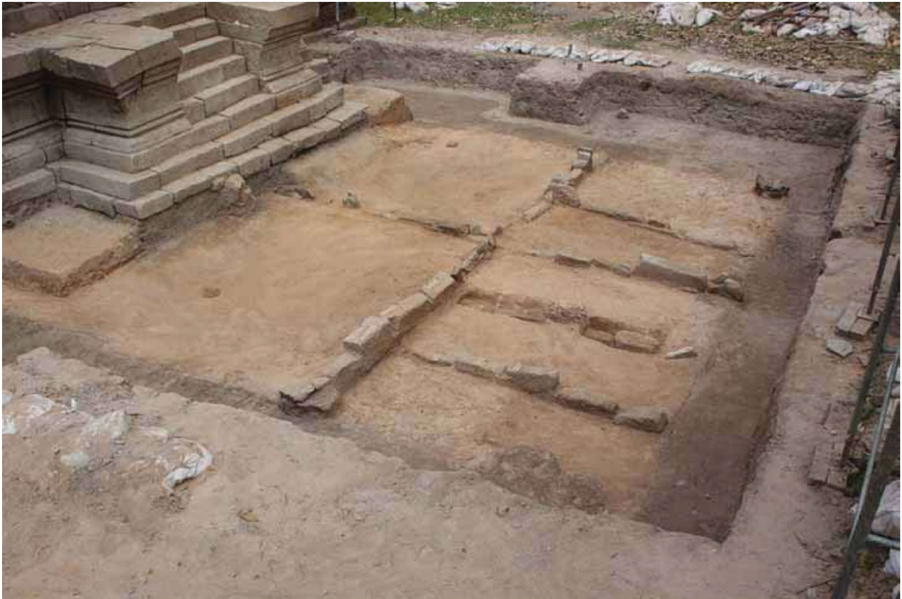
南祠堂下成基壇までの解体を完了した時点で、掘込地業内の石列の全体像が明らかになった（南西から） The lines of stones inside the basement are uncovered clearly after the total dismantling of the lower base of the Southern Sanctuary (from the southwest)