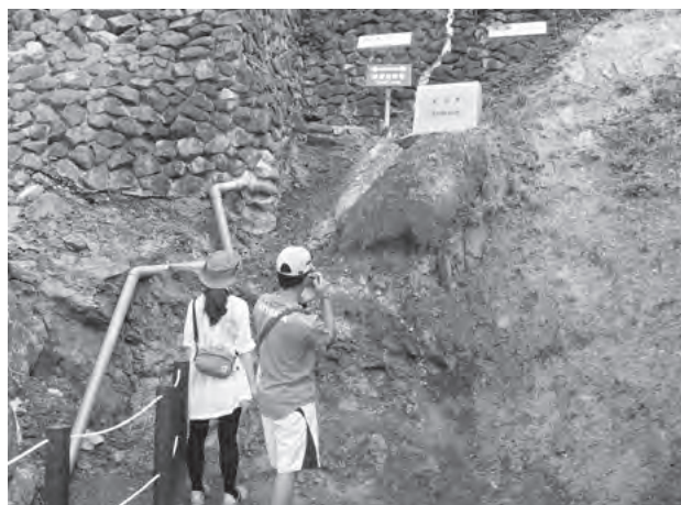
図-3. 糸魚川-静岡構造線の断層