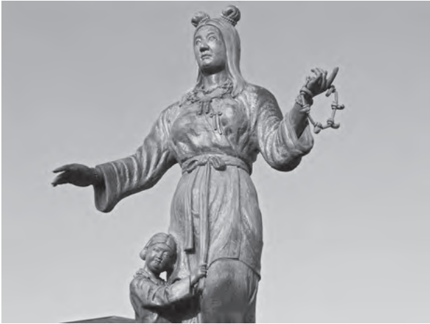
図－5. 奴奈川姫と建御名方命

掘されて基礎が展示)が雪崩に襲われ、犠牲になったボッカを供養する白池地蔵が道のわきにたたずんでいる。