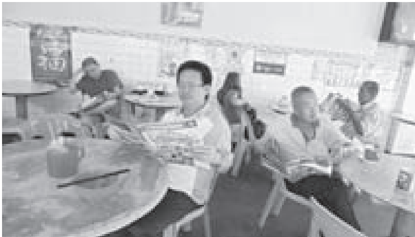
図-6. 一般市民向けの広報コーナー