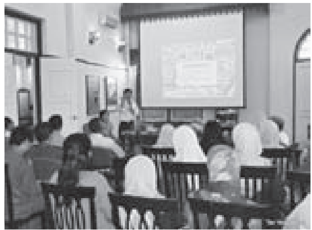
図-3. 地方自治体向け能力構築講座

CHATは、一般市民の参加を促すためにさまざまな戦略を採った。CHATのメンバーを紹介するとともに、幾例かの文化遺産に関する関心の高まりを紹介する第一歩として、「談話」形式を用いた。談話集会が成功すれば、文化遺産の建築物を議論するための現地探査への参加や、専門家による相談の希望等、更なる取組に繋がっていくことになる。一般市民、大小の不動産所有者、地方自治体職員および不動産周旋業者を含め、それぞれ特定グループ向けに企画された教育関連の話し合いやワークショップが実施された。