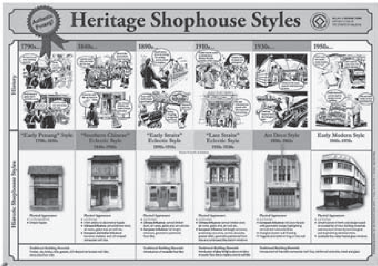
図-5. ショップハウスの歴史的発展過程を示したポスター

文化遺産地区に悪影響を及ぼす問題本位のテーマや議題に取り組んだ。また内容は、全ての文化集団における体験や実話に焦点を当てて、個人的かつ包括的なものとした。CHATは更に、個人相談サービス、信頼できる保存建築家や建築請負業者の一覧案内サービス、およびネットワークサービスを提供した。