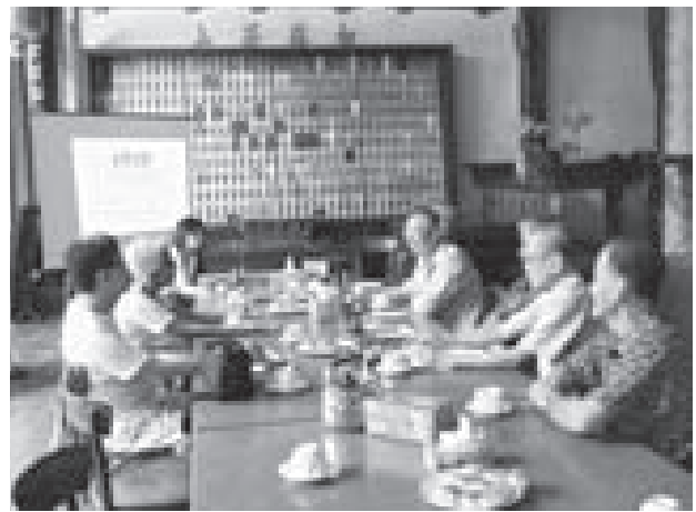
図-2. 不動産所有者との話し合い