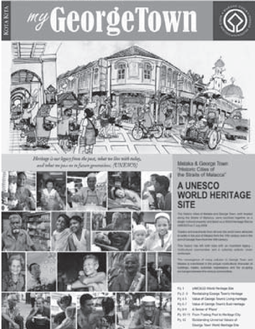
図-4. コミュニティ・ニュース

対面でのやりとりの場を設けること以外にも、さまざまな一般市民向け教材を作成した。これらの教材には、公開展示会、地方紙、ポスター、小冊子、技術書、ブログ、ウェブサイト等が含まれる。我々は、単なる調査や事実を伝えるだけでは効果が無いことを学んだ。住民の多くは文書を読む習慣がないので、我々はアーティストを使って、(文化遺跡地域に関する)事実と指針を視覚的に理解しやすい形式に変えて伝えることにした。我々はまたもや、大いに想像力、比喩、会話形式や挿話形式