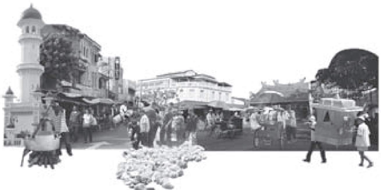
図-1. ジョージタウンの多文化世界遺産 [合成写真]

世界遺産地域 (WHS) 登録推薦および関連調査書類の作成にあたっては、少数の専門家グループ、学者、および締約国 (この場合は中央政府)、さらに資料提供者である地元自治体が関与した。地元自治体と地方政府は、推薦過程で随時協議を重ねた。世界遺産地域内で生活し働いている地域共同体の人々は、この推薦過程に参加していなかった。登録のニュースは、新聞記事や地元自治体作成の簡素な印刷物を通じて初めて一般市民に知らされた。