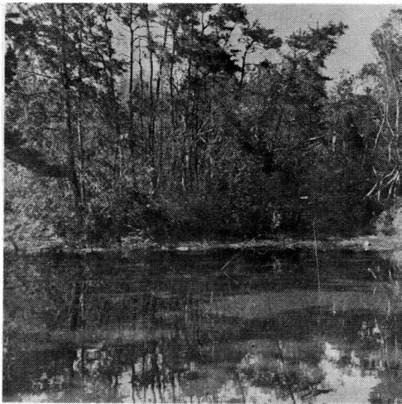
第10図 伝称徳天皇御山荘池跡