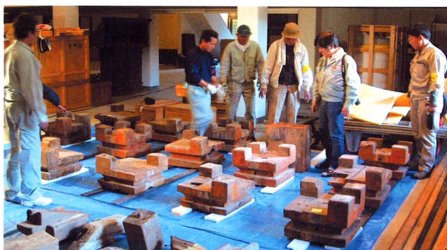
法隆寺中門部材選定風景（上・下）