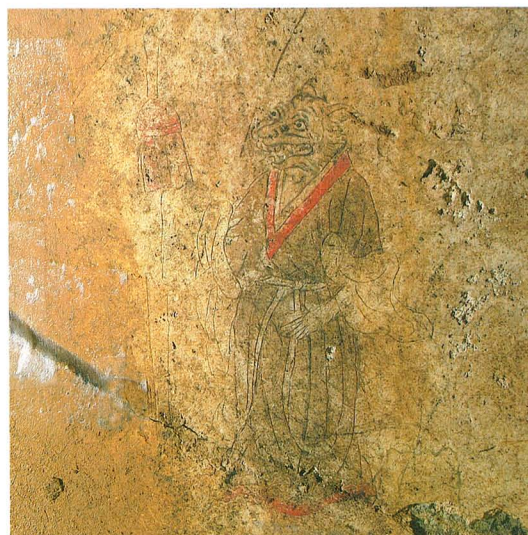
表紙：キトラ古墳壁画の十二支寅像

十二支の寅像は青龍の描かれた東壁の下北側にある。身長は約14cm。襟と裾が赤い長衣を着ており、右手には房飾りのついた矛状の武器をもつ。輪郭線は浅く窪んでおり、下絵をヘラ状工具でなぞったと推測している（寅像左に白く見えるのは応急保護措置として貼ったレーヨン紙）。