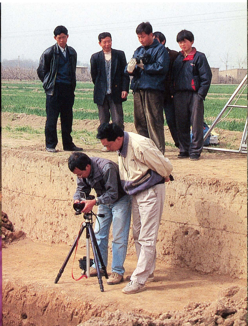
漢長安城での日中学術調査 Japanese-Chinese scientific investigation of the Han Dynasty capital Chang An