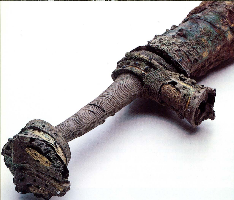
保存処理を行った藤ノ木古墳の剣とX線CT 3次元画像による柄内部