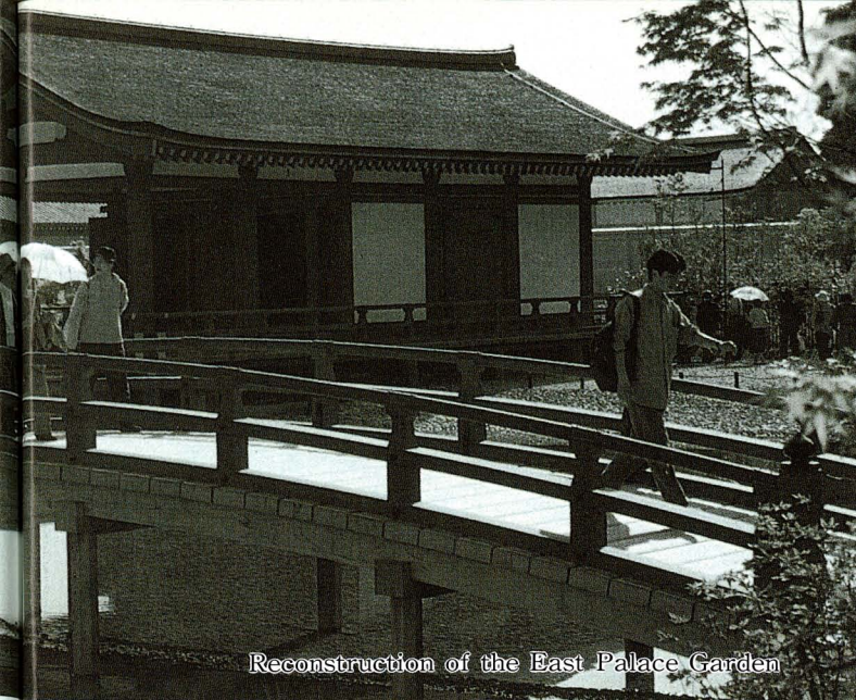
Reconstruction of the East Palace Garden