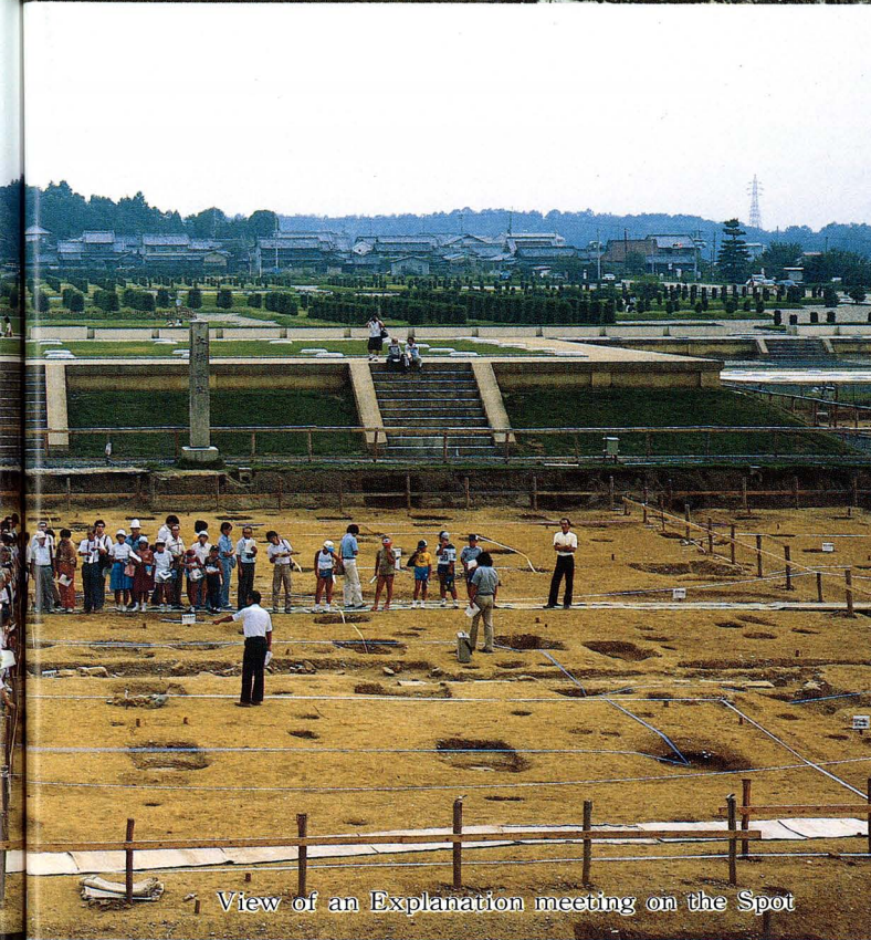
View of an Explanation meeting on the Spot