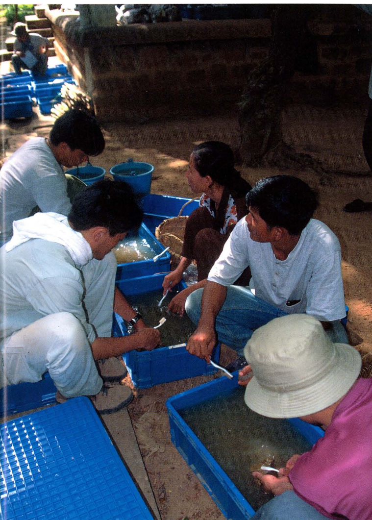
カンボジアでの窯跡調査 Investigation of a Tani kiln site in Cambodia