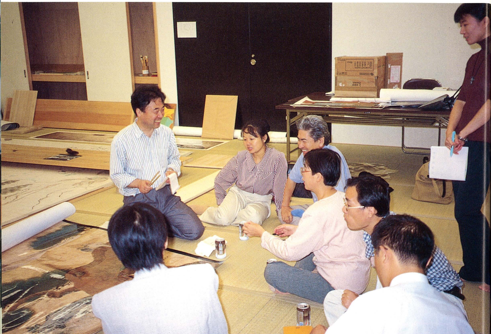
唐代古墳壁画修復の技術的検討