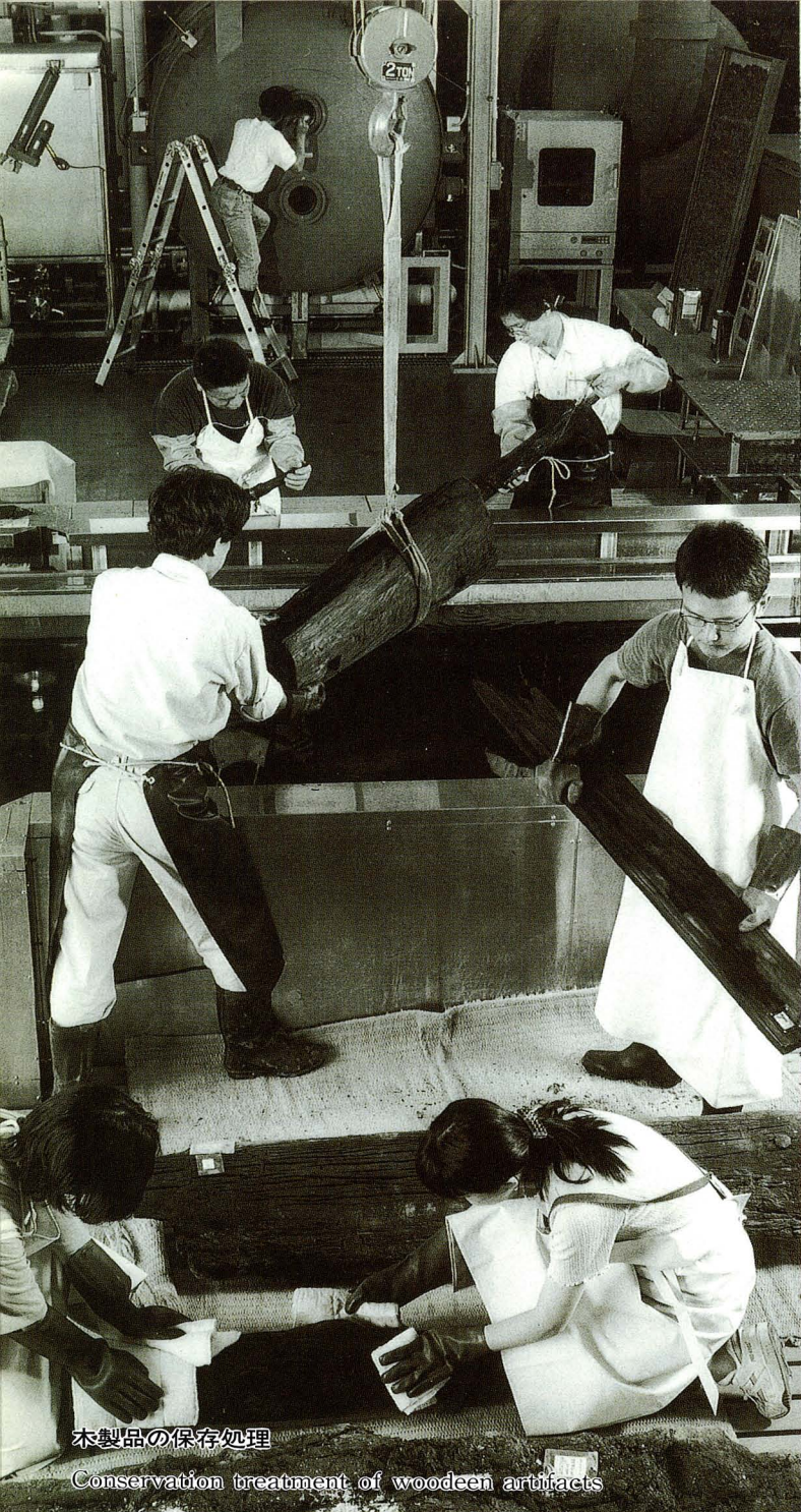
木製品の保存処理