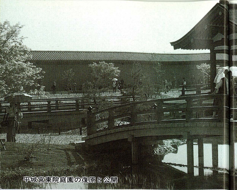
平城宮東院庭園の復原と公開