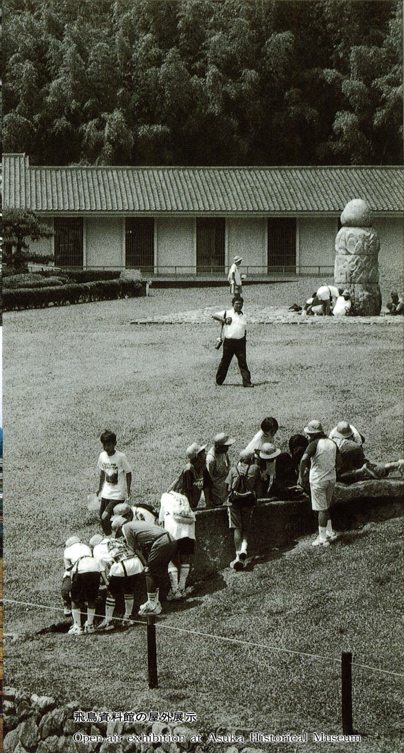
飛鳥資料館の屋外展示