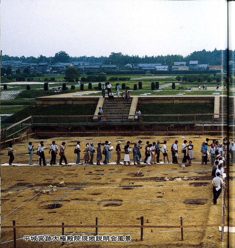
平城宮跡大極殿院現地説明会風景