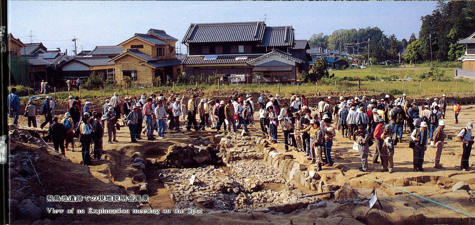
飛鳥池遺跡での現地説明会風景