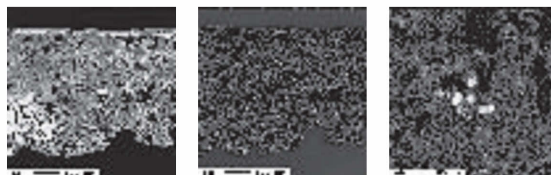
図43 下地漆喰のBSE画像(左)および鉛分布測定図(中央・右)