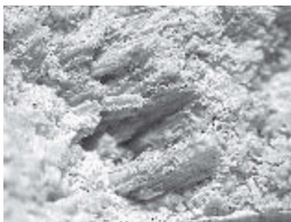
図41 化石化したスサ状物質（写真の横幅は5mm）

下地漆喰は目地漆喰と同じように空隙が多数存在していることが特徴的である。その形状は多様で一定せず、多くは虫食い状を呈し、一部では扁平にして連続的に伸びる空隙も認められた。断面中央部付近の空隙は、二次的に形成したサッカロイダルなカルサイト（アラゴナイトも存在する？）が充填しており、表層付近では、空隙の周辺部だけに結晶が成長しているなどの特徴が見られた。つまり、表層は連続する空隙が多く存在しており、きわめて陥没しやすい状態にあることが明確になった。これらの空隙は、目地漆喰と同様にスサが充填されていたと考えられる（目地漆喰のスサと下地漆喰のスサは異なっていたと推定される）。つまり、本来、ひび割れ防止等の目的で添加されていたスサが消失することにより、漆喰は急激に劣化をはじめ、多くのひび割れが発生して、さらに剥落へと進んだものと考えられる。目地漆喰のスサと同様