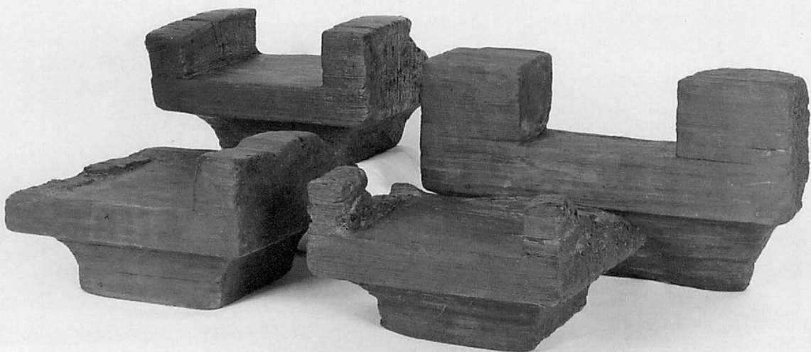
7. 上 平城京左京二条二坊十三坪出土漆器 8. 下 山田寺出土斗拱