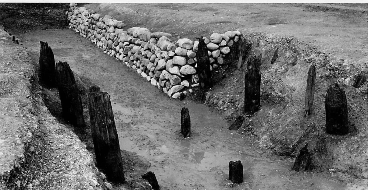
3. 上 閣門下層の門(東から)