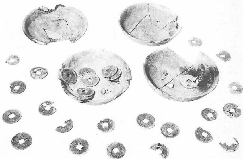
7 上 平城宮跡出土木簡 下 平城京右京八条一坊十三坪出土地鎮具