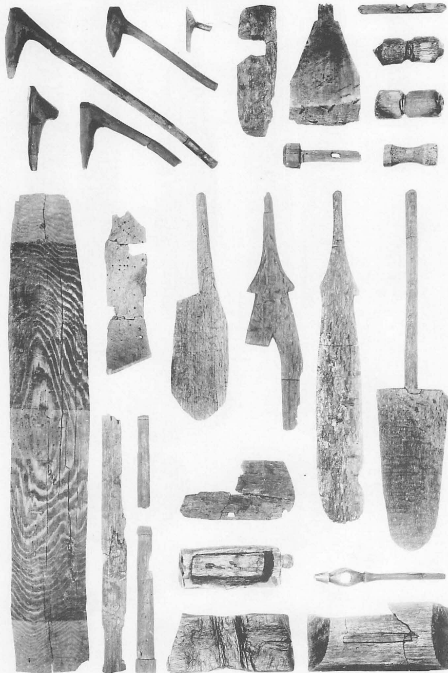
8 平城宮第一次朝堂院東南地区古墳時代河川出土木製品(ㄨ)