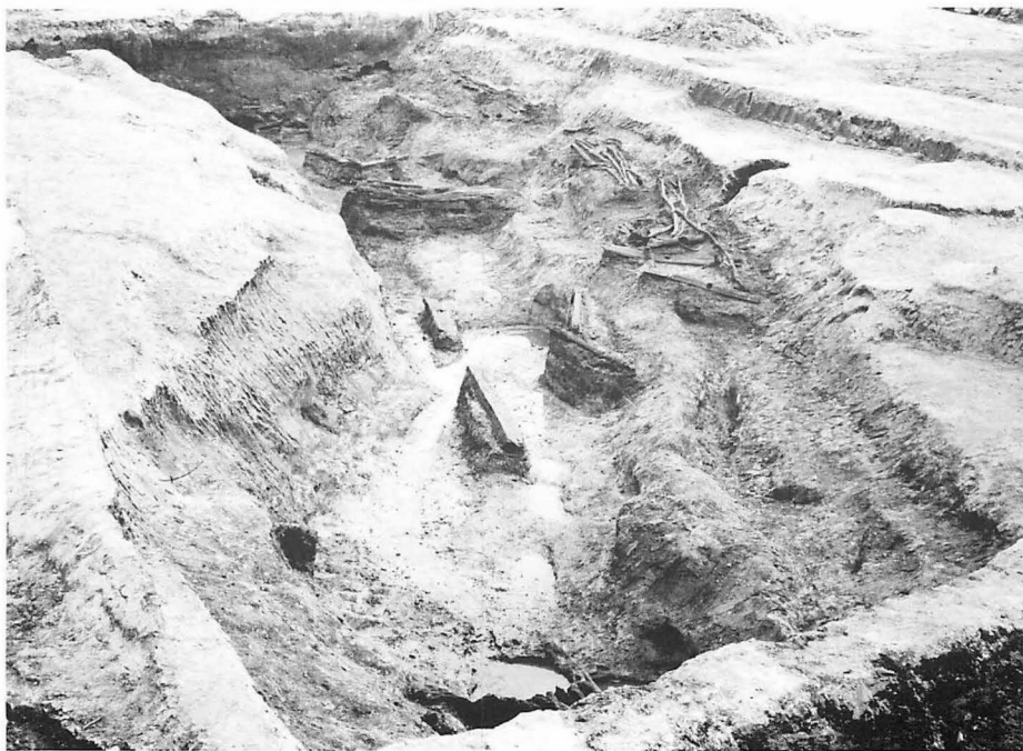
5 上 平城宮第一次朝堂院東南地区(西から) 下 平城宮第一次朝堂院東南地区古墳時代河川(南西から)