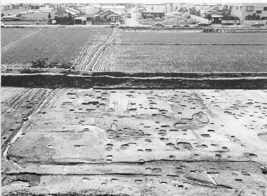
6 上 平城京右京八条一坊十三・十四坪(北東から) 下 平城京左京九条三坊十坪 \frac{1}{2} 町宅地(東から)