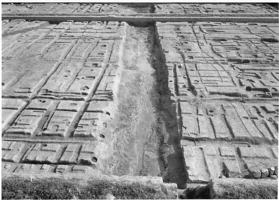
上 藤原宮第55次(東方官衙)調査区全景(北から) 下 藤原宮第55次(東方官衙)東大溝(北から)