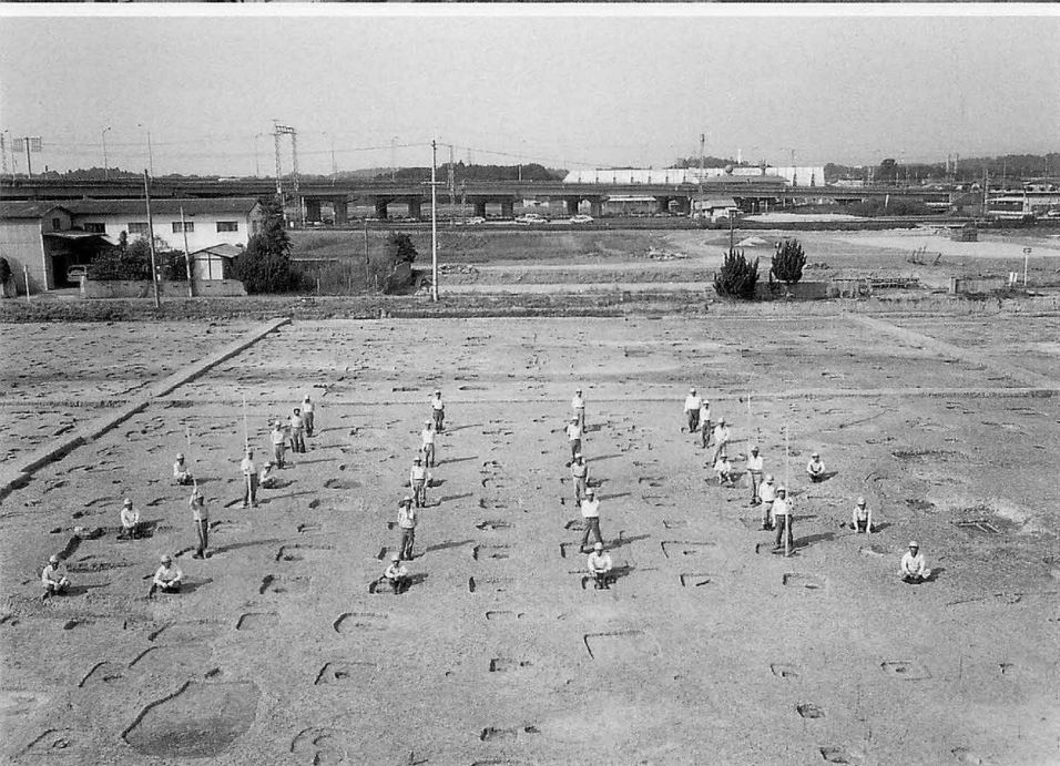
上 平城京左京三条二坊七坪(北西から) 下 平城京左京三条二坊七坪及堂(南から)