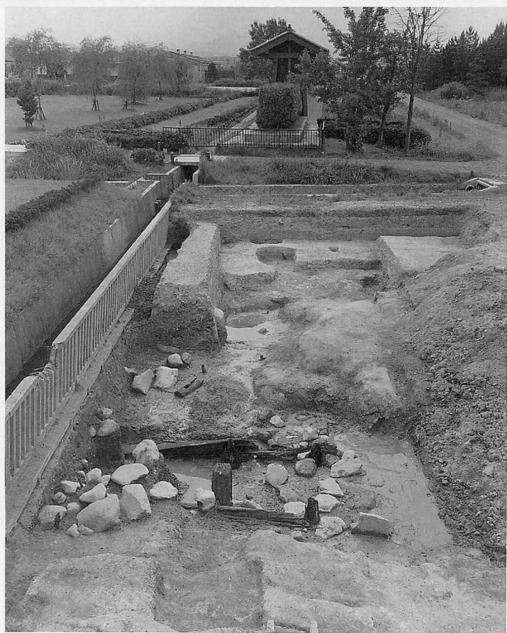
上 平城宮兵部省地区(南から) 下 平城宮南面大垣と大溝 SD 3715 交差点(東から)