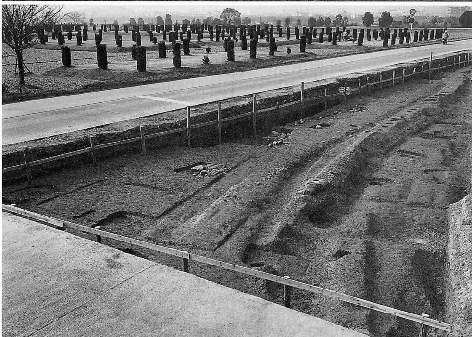
上 平城宮造酒司地区(南から) 下 平城宮内裏東北隅築地回廊(東北から)