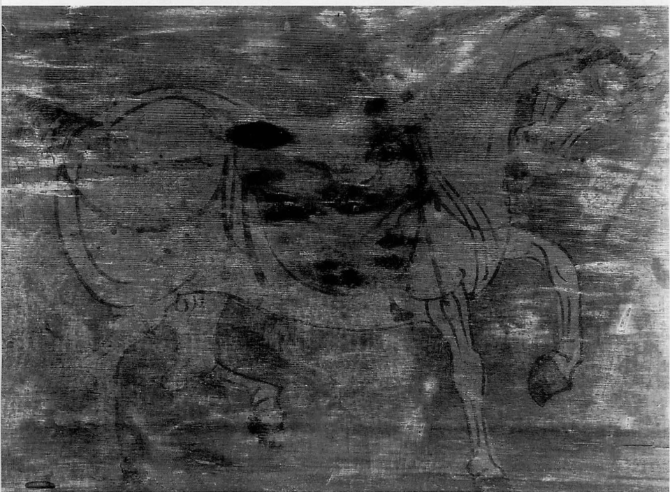
6 上 楼閣山水之図（平城京二条大路上の東西大溝 SD5300から出土） 部分写真 下 絵馬（平城京二条大路上の東西大溝 SD5300から出土）