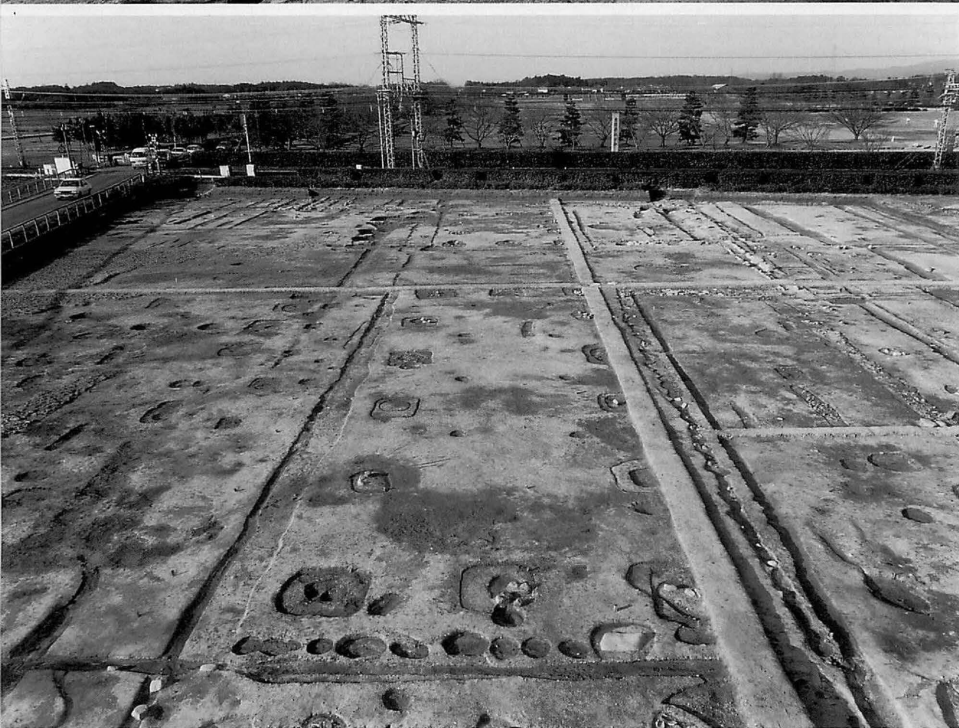
4 上 平城宮第211次(朱雀門)調査区(東から) 下 平城宮第206次(兵部省)調査区(南から)