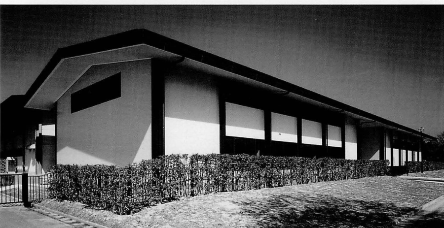
遺物解析・処理棟（南東から）