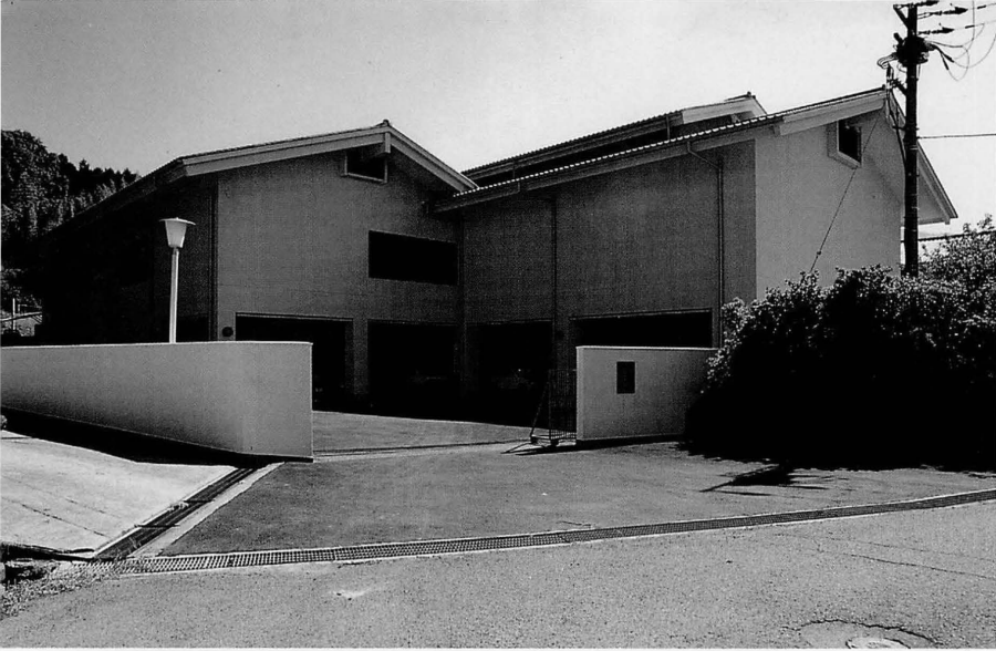
飛鳥資料館展示棟増築部分（北西から）