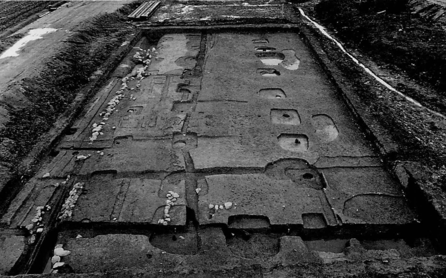
藤原宮第71-13次 藤原京 左京十一條三坊（雷丘北方 遺跡4次）の南庇付東西棟 SB2850（東から）