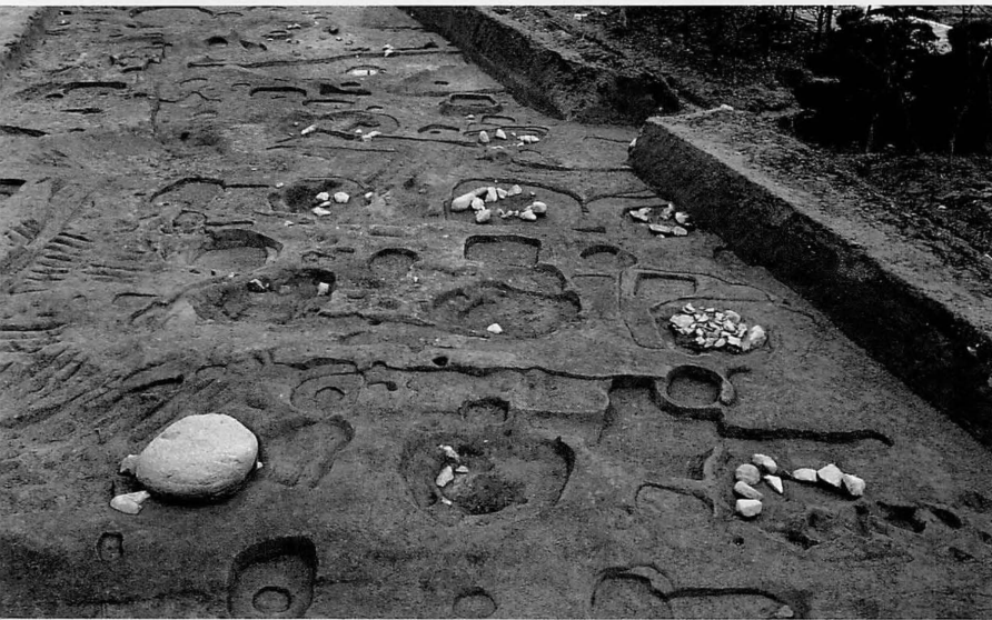
藤原宮第71-14次 藤原京 左京十二條三坊（雷丘東方 遺跡）の礎石建ち総柱建物 SB3030（南から）