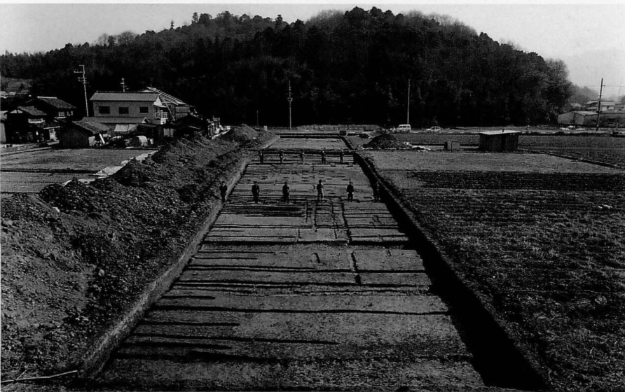
藤原宮第74次 東二坊大路 より藤原京左京七條三坊西 南坪内を区画する南北塀を のぞむ（西から）