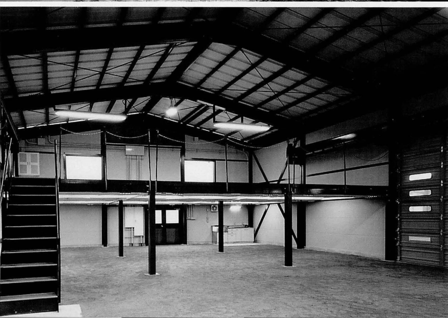
資材保管加工棟の内部