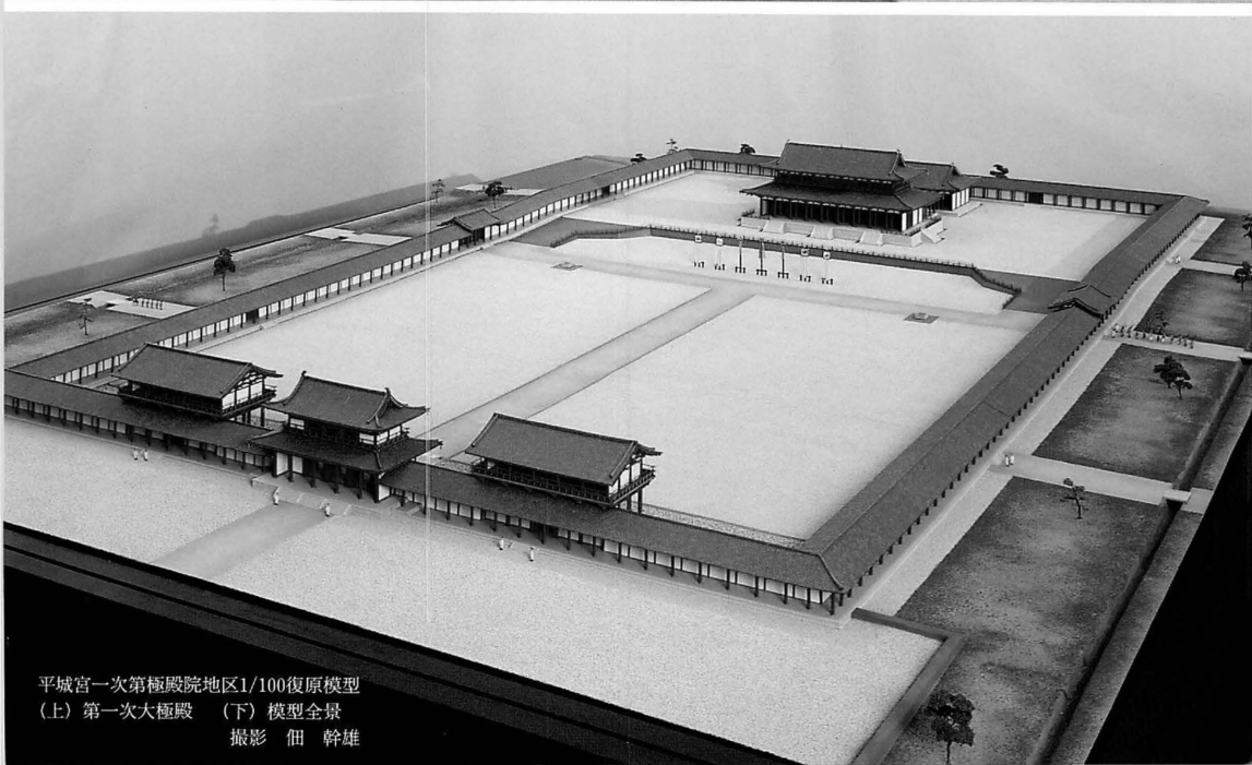
平城宮一次第極殿院地区1/100復原模型