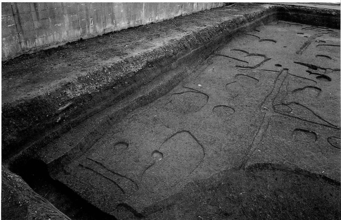
左上 平城京第247次 頭塔 西調査区(北から) 撮影 佃 幹雄 右上 平城京第242-19次 西大寺 礎石建物(北から) 撮影 佃 幹雄 下 平城京第242-12次 西隆寺 南面回廊 SC650北側柱列(東北から) 撮影 牛嶋 茂