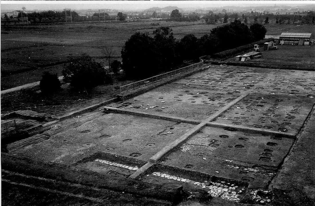
左上 平城宮第243次 東院地区官衙の北を区画する単廊 SC16200 (西から) 撮影 佃 幹雄 右上 平城宮第243次 東院南門 SB16000 (西から) 撮影 牛嶋 茂 下 平城宮第243次 東院地区の調査 (東北から) 撮影 佃 幹雄