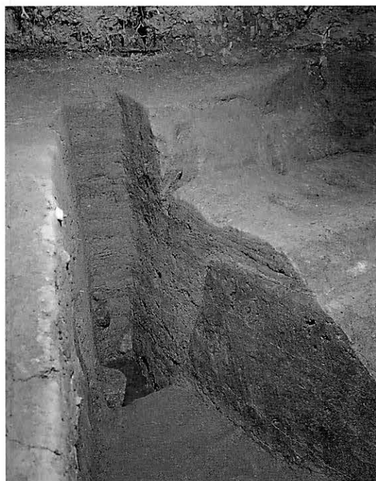
↑(上)吉備池廃寺金堂基壇

金堂は、掘込地業をともなう高い基壇をもつ。これは、基壇の北辺を東からみた写真である。基壇土が掘込地業の外側まで広がっている。平行して、礫を投棄した近世の溝がめぐるが、礫自体は、ほんらい、基壇にともなうものであろう。遠方に見えるのは塔と推定される西方土壇である。本文85頁参照