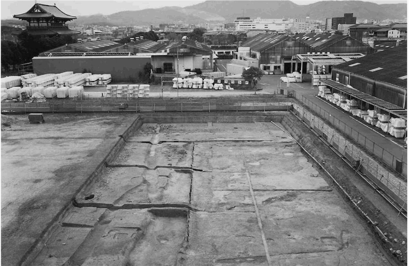
図 205 第 448 次調査区全景 (西から)