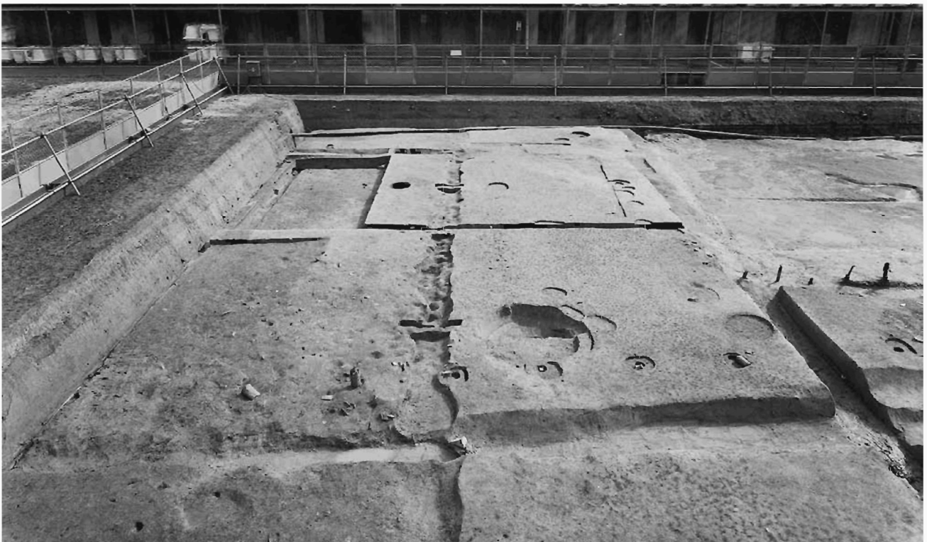
図 206 調査区東側で検出した L 字状の溝 (北から)