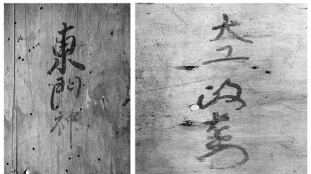
図19 三歳社外観および墨書