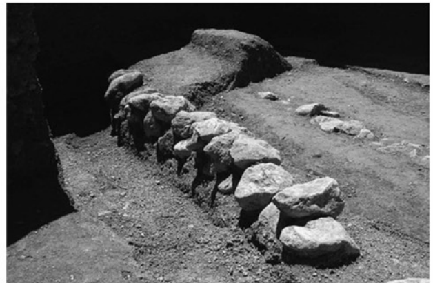
図35 ガリーブ・アーバード地区GA9調査区で検出された土壁遺構（北から）