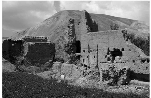
図37 カクラク谷中流部のカラ（カラエ・チョクラク）

さらに谷を6～9km遡ると、ドゥカーニー村を中心とした平野部が開け、そこでは4箇所のカラ（城）をはじめ、いくつかの古墓、石窟群、ジアラット（巡礼地）を確認した。カラとは、一辺20～30m四方の範囲を土壁もしくは日干し煉瓦の壁で囲み、その四隅に平面円形もしくは多角形の塔を配する建築で、19世紀頃に建てられた領主の城・屋敷である。これらのカラは、村人の証言によると、4兄弟の領主によってそれぞれ建てられたものだ