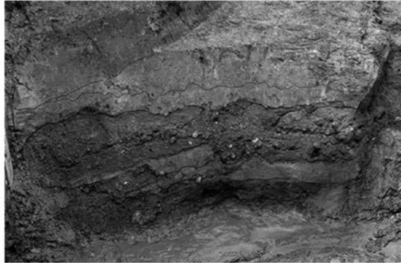
図136 A区SD380 (東から)

いた可能性もある。さらに護岸の外側、SD380の縁に沿って幅70cmあまりにわたって、榛原石を貼石状に敷き詰めていた。これも護岸と一連の造作と考えられる。