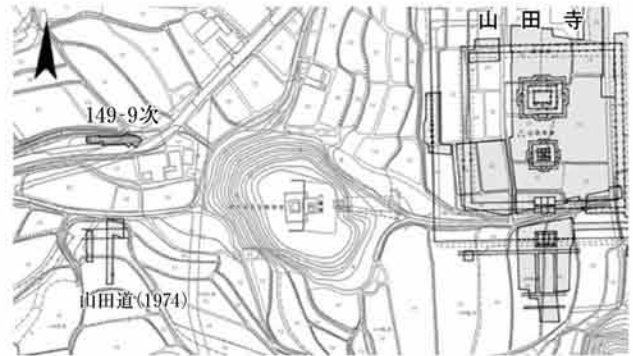
図134 第149-9次調査位置図 1:4000

A 区 埋設管等により調査区の約2/3が削平されていた。残る1/3についても古代の遺構面は認められず、流路跡SD380が1条確認されたのみである（図136）。SD380は南から北の方向に走向し、南北長4.4m分が遺存していた。流路の東西幅に関しては、埋設管による攪乱のため不明である。流路内に堆積した青灰色砂層中に近世～近代の磁器片や土師質皿などが混入することから、近世以降の流路とみられる。また、この砂層からは土器、陶磁