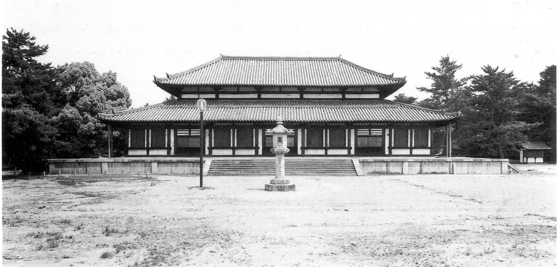
第4図 文政再建興福寺中金堂（平成12年解体）

明治維新に際し興福寺の寺院処遇が廃止されると、中金堂も官没され、中教院などに転用された。その際、須弥壇を削り、内部全面にわたり礎石から約75cmの高さに床を張り、一部に天井を設け、いくつかの小部屋を設けるなど、大幅な改造が施された。その後、明治14年2月、興福寺再興復号が許可されると、中金堂も寺に返還され、復旧が施された。変転を経ながらもこの堂は180年の長きにわたり建ち続け、「赤堂」と呼び親しまれるようになったが、第I期境内整備事業計画の一環として、平成12年、惜しまれつつ解体された。