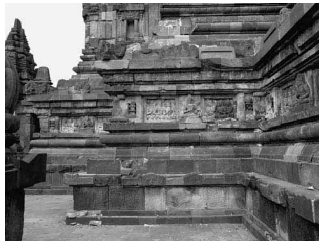
図14 シヴァ祠堂の身舎脚部の亀裂

(追記) 平成19年2月23日～3月9日に第二次調査が実施された。その成果は今年度に報告される予定である。