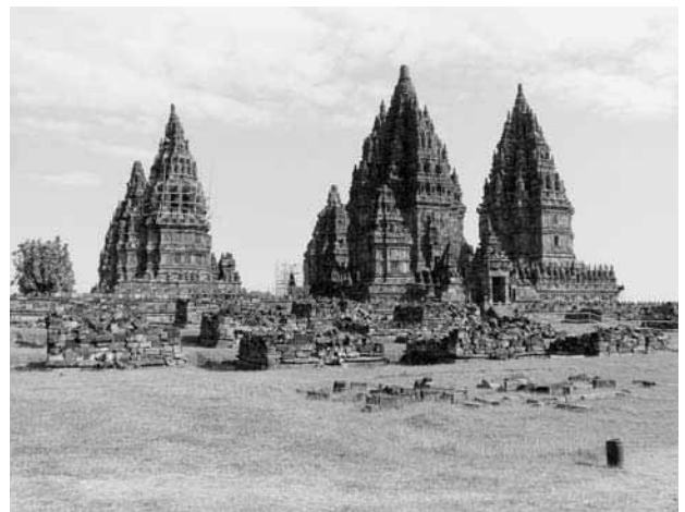
図12 プランバナン寺院全景

これら寺院は1549年の大地震によって崩壊し、オランダ統治時代の1733年に至って発見された。本格的な修復は1937年からオランダ領東インド考古局によって始まり、1945年のインドネシア独立後は、インドネシア考古局がそれを引き継いだ。プランバナン寺院では1953年にシヴァ祠堂が竣工し、1993年には内苑全ての祠堂の修復を完了していた。なお、主要な祠堂の修復手法については石積み内部、および見え隠れ部分に鉄筋コンクリートフレーム(柱、梁)によって補強をおこなっていることが知られている。