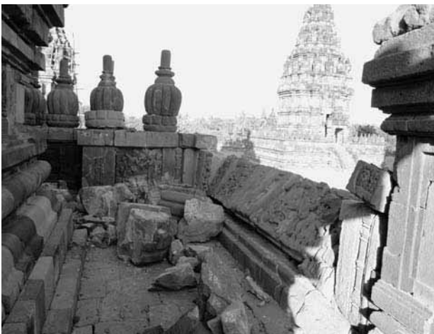
図13 基壇上部の被害状況

なお、地震被害は祠堂内部の構造にまで至っている可能性が高いが、目視による観察では把握できず、過去の修復手法の把握とともに、詳細な調査が求められる。