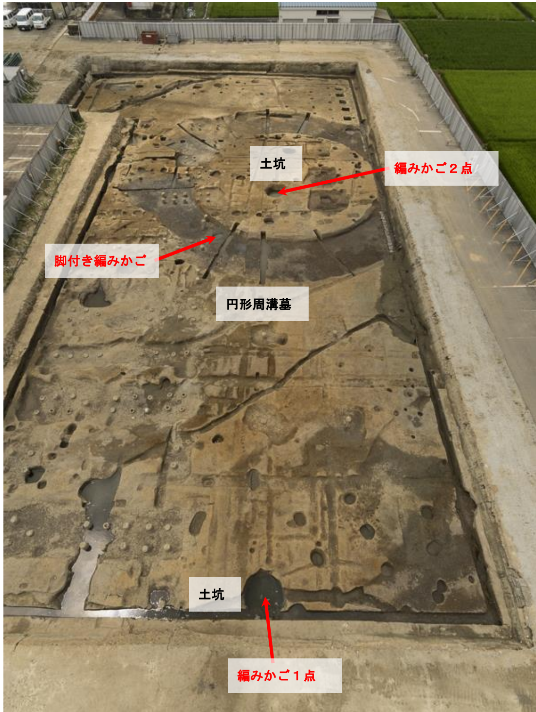
写真1 調査区全景と編みかごの出土地点（東から）