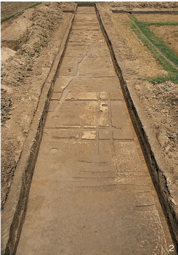
1. III区全景 北から 2. III区全景 南から