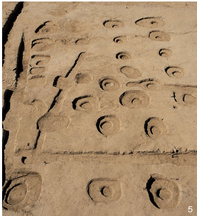
3. IV区全景 東から 4. 東三坊坊間路SF4300、両側溝SD4301・4302 南から 5. III-A期の建物SB4140、IV期の建物SB4150 南から