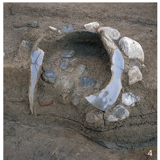
1. III-B期の東脇殿SB4332 北から 3. III-B期の井戸SE4335、SK4325 南から