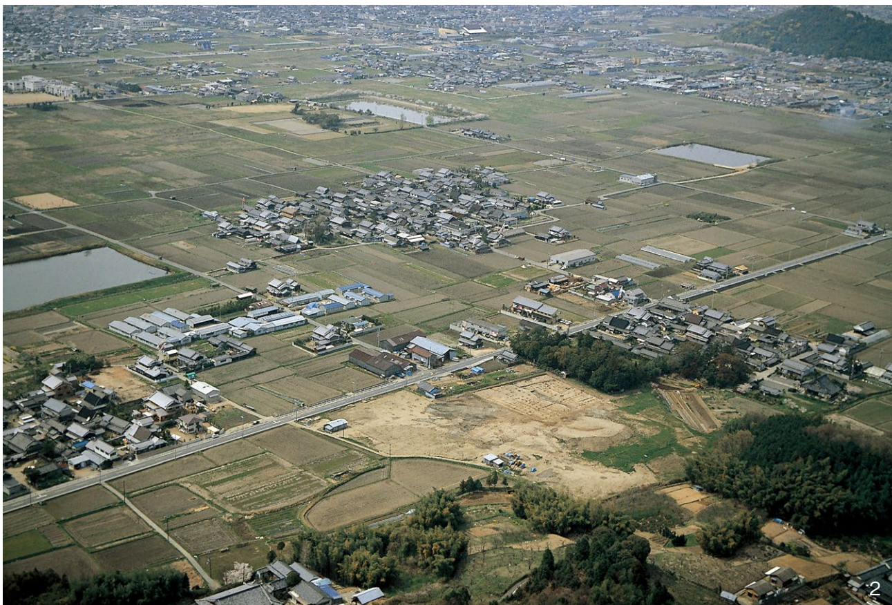
1. 遺跡遠景第45次調査 北西から 遠方は香具山