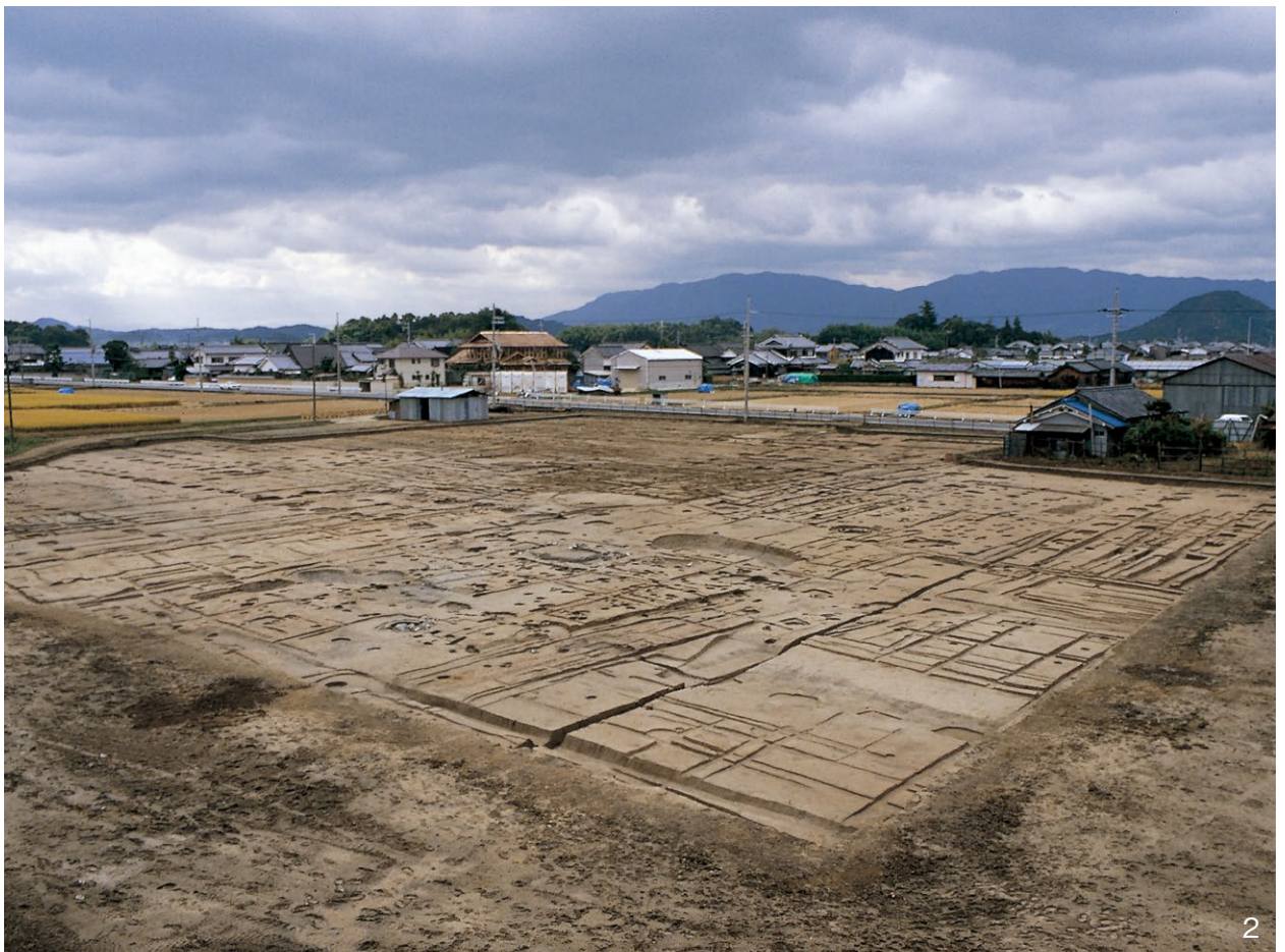
1. 調査区全景 南東から