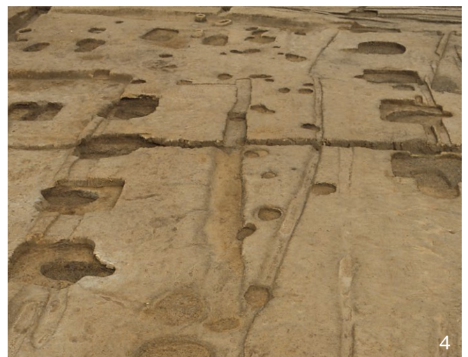
1. III-C期の前殿SB4340 東から