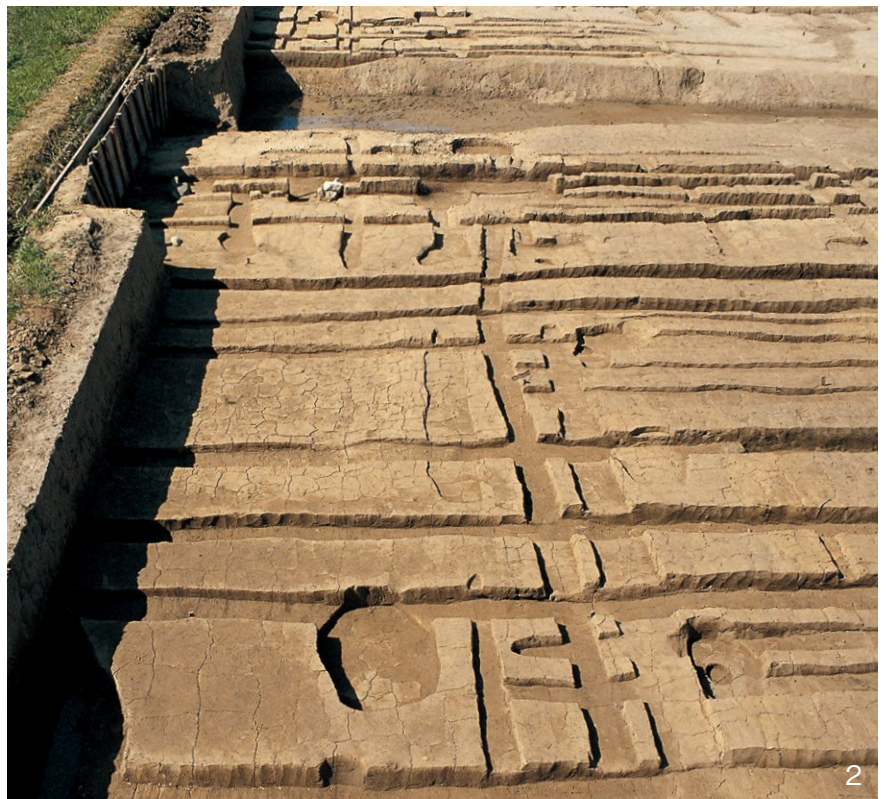
1. Ⅲ-A期の区画塀SA4170、建物SB4175 北から 2. Ⅲ-A期の区画塀SA4170・4171 南から