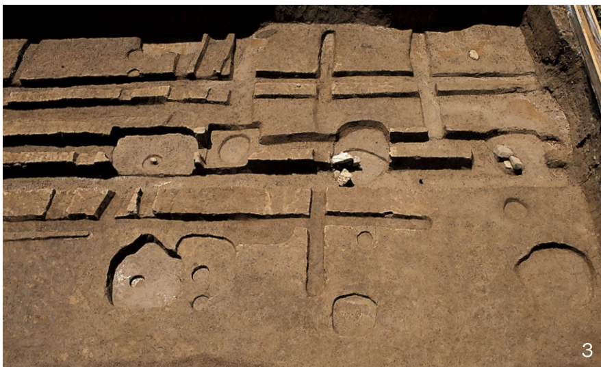
1. I区(東)全景 西から 2. I区(西)全景 西から 3. III-A期の区画塀SA4170、建物SB4761 北から