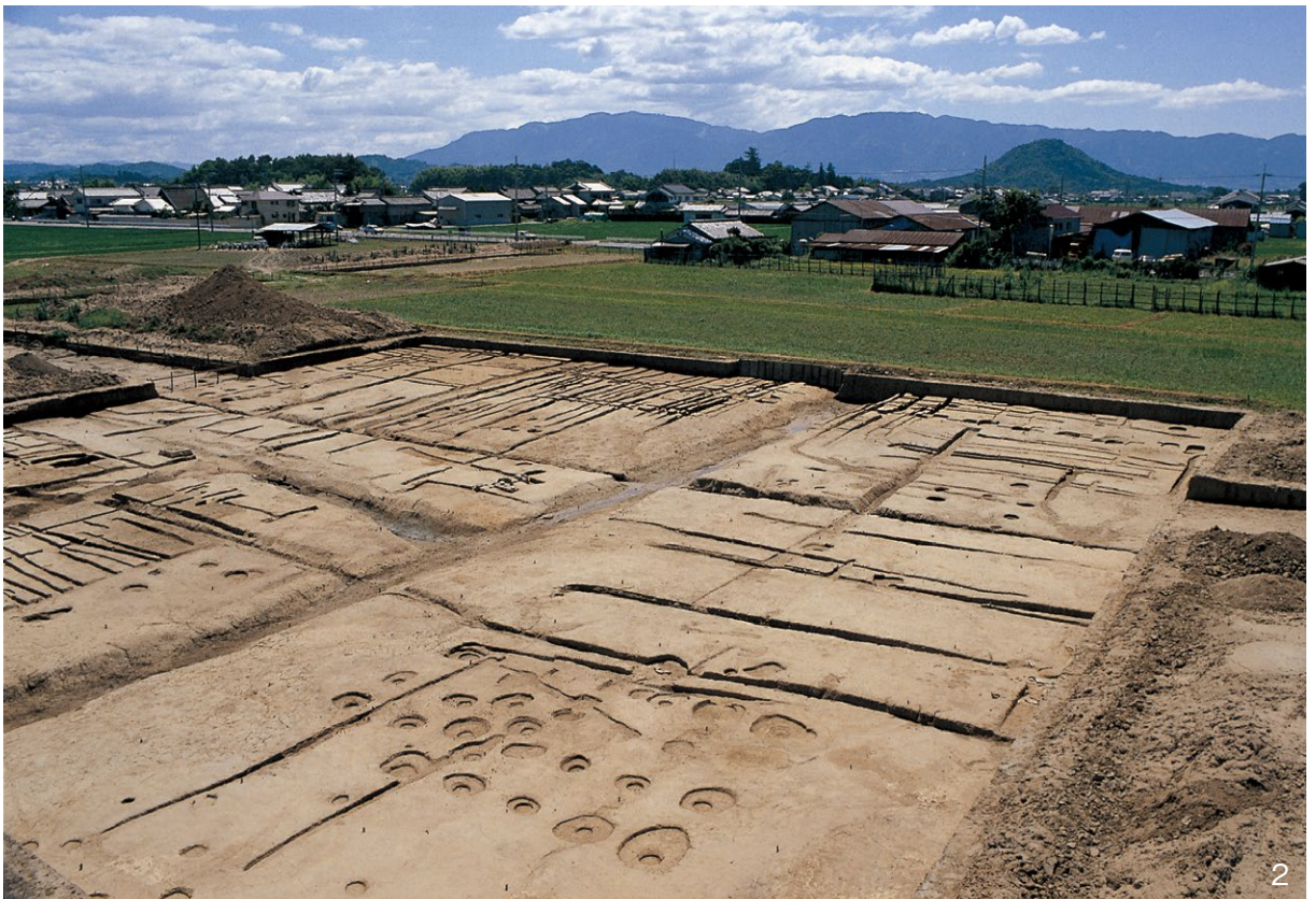
1. 調査区全景 北から 2. 中央区全景 北東から