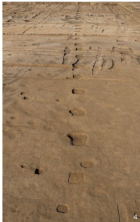
1. Ⅲ-B期の区画塀SA4286 北から 2. Ⅲ-B期の区画塀SA4286 南から