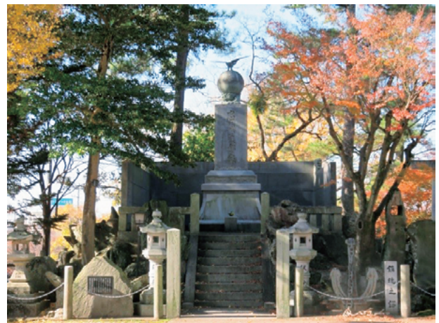
図3 岡崎公園内の「忠義護邦家」碑

近代城跡は何れの地でも少なからぬ記念碑が建てられる場所だった。慰霊と顕彰の空間であった。こ