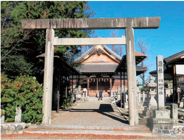
図4 九華公園内の鎮国守国神社

た。定信存世中であつたことから、この木像安置という行為は「生祠」の誕生であつた。渋沢栄一は『楽翁公伝』で、「公は死後神となつて国を守るという意志がある」と指摘したが、すでに生前から神格化されようとしていた。文化4年定信は遺書を書き、それを封書して残した。そこには死後には「諡は守国院と称すべし」と記されていた。文政3年(1820)8月定信が書いた『自書略伝』には、「我十二歳の頃より、生れは天下の為に忠を盡し、死ては忠義の鬼とならむことを思ひ立て」とあり、「追つて守国大明神の号を京都より請うべし」との意思を示していた。