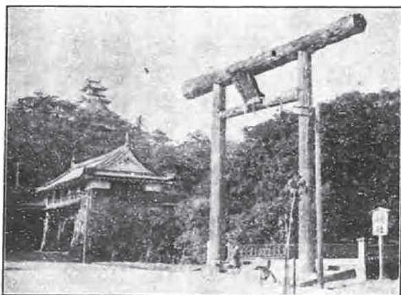
図6 高知城追手門脇の藤並宮 （高知市初等教育研究会編『高知読本』より）

創建の前年、文化2年（1805）閏8月5日の藩の触には、「一豊公尊霊此度神社ニ御祝被遊、於京都吉田勸請相濟、御当地へ御迎被成、明後六日御神霊御下向之御趣御左右相達候」とあり、京都の神祇管領家吉田家から神号「藤並明神」が授与され、一豊の神霊が高知に勸請されたのである。