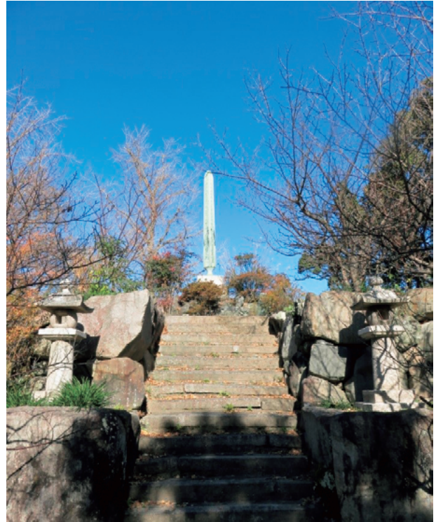
図5 九華公園内の「旧桑名藩士民招魂碑」