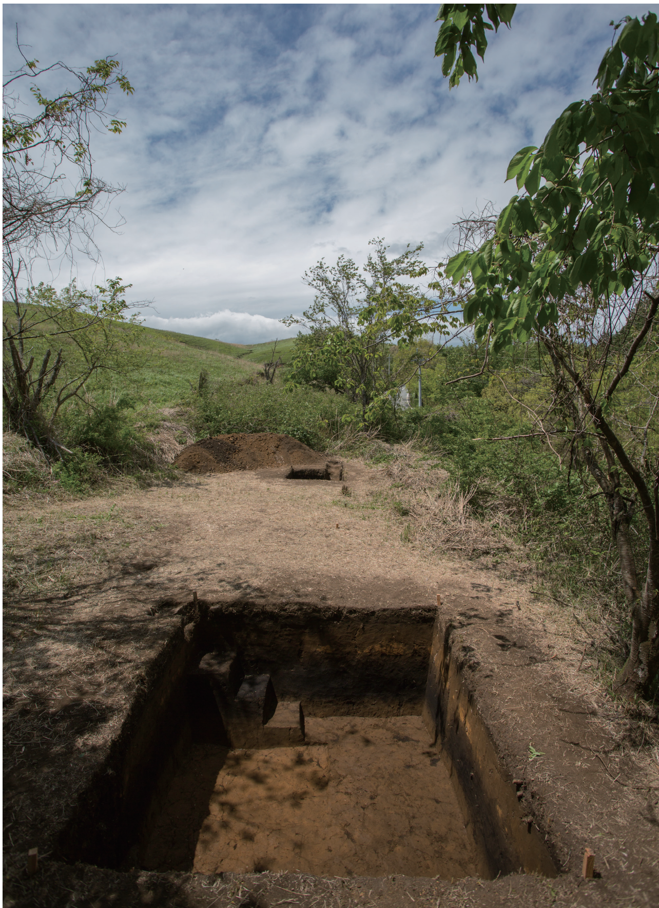
6層完掘状況（東から） 奥が1トレンチ、手前が2トレンチ