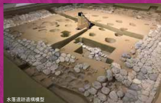
水落遺跡遺構模型