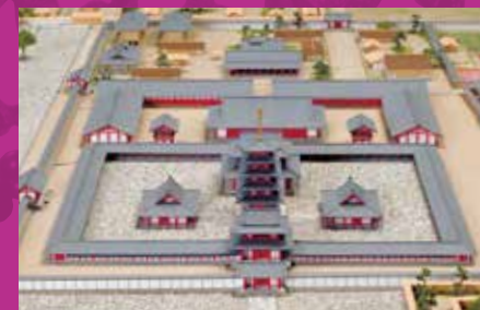
飛鳥寺之塔（古代飛鳥模型的一部分）