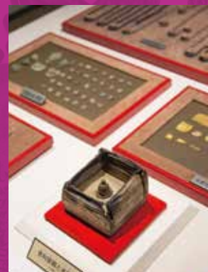
飛鳥寺塔的秘密之寶