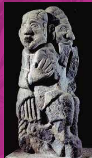
石人像 石神遺跡出土

展出重現飛鳥時代首都風貌的古代飛鳥模型與曾被作為噴泉使用的石人像實物。可親身感受到飛鳥時代的氣息。