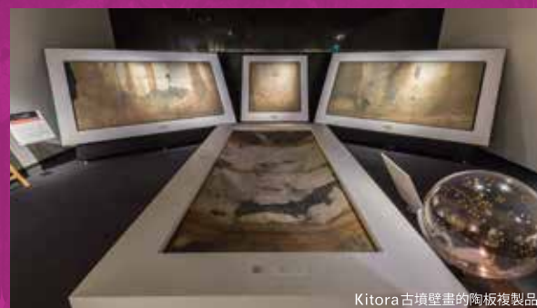
Kitora 古墳壁畫的陶板複製品