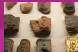
山田寺遺跡出土文物