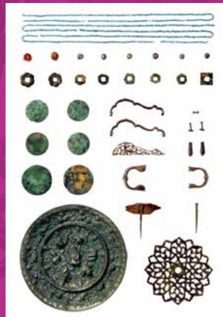
高松塚古墳出土文物

展示從寺院、宮殿和古墳等遺跡出土的眾多實物資料。可從中瞭解飛鳥的歷史與文化的整體概況。