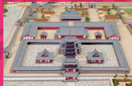
飞鸟寺之塔（古代飞鸟模型的一部分）