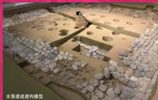
水落遗迹构造模型