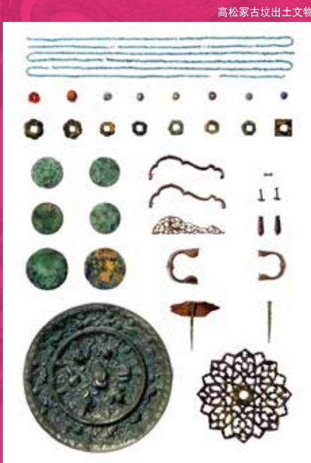
高松冢古坟出土文物

展示从寺院、宫殿和古坟等遗迹出土的众多实物资料。可从中了解飞鸟的历史与文化的整体概况。