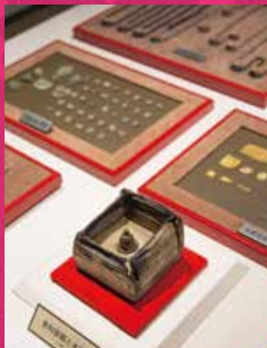
飞鸟寺塔的秘密之宝