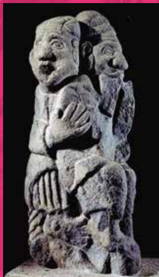
石人像 石神遗迹出土

展出重现飞鸟时代首都风貌的古代飞鸟模型与曾被作为喷泉使用的石人像实物。可亲身感受到飞鸟时代的气息。