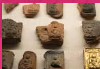
山田寺遗迹出土文物