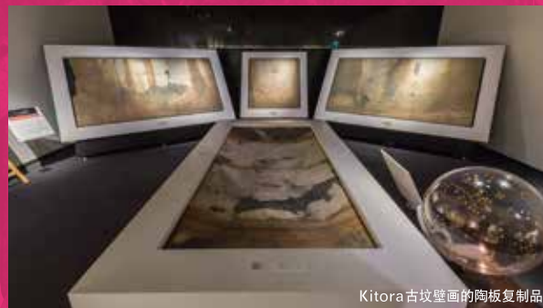
Kitora 古坟壁画画的陶板复制品