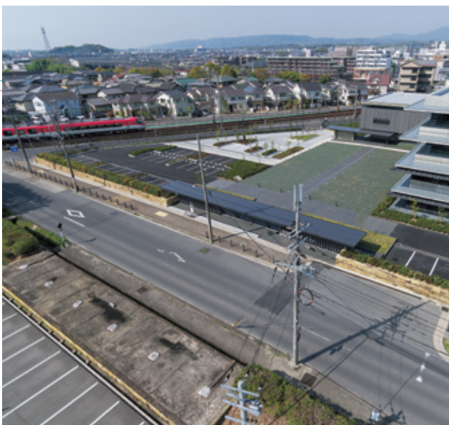
⑥ 現在の佐伯門跡周辺の様子