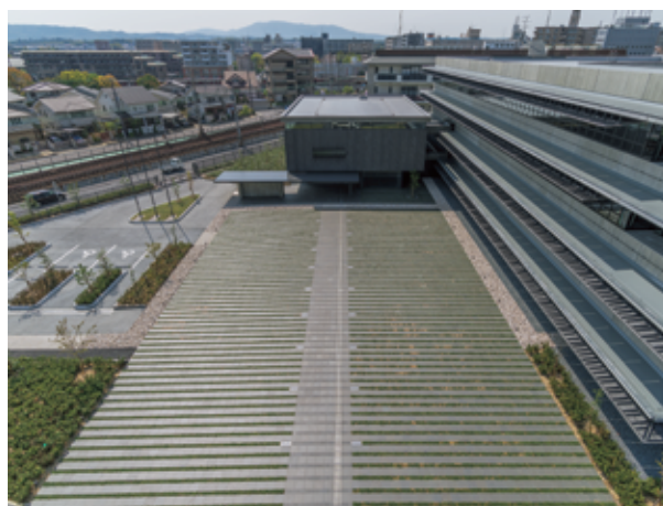
① 一条南大路跡 (東から)