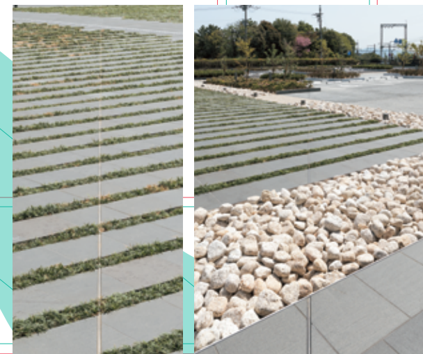
② 斜行大溝北岸の表示 ③ 斜行大溝南岸及び排水溝の表示

発掘調査では両大路が建設される前には秋篠川の旧流路を利用した斜行大溝が確認され、その兩岸の位置を厚さ 5 ミリメートルの金属プレートを模式的に埋め込んで表示しました。この斜行大溝は敷葉・敷粗朶工法により埋め立てられており、敷き詰められていた枝葉はツブラジイ、ヒサカキ、二葉マツ (クロマツ) 等のものでした。そのため、エントランス棟の南側にこれらの樹木を植え、1階のホールから窓越しに学習できるようにしました。