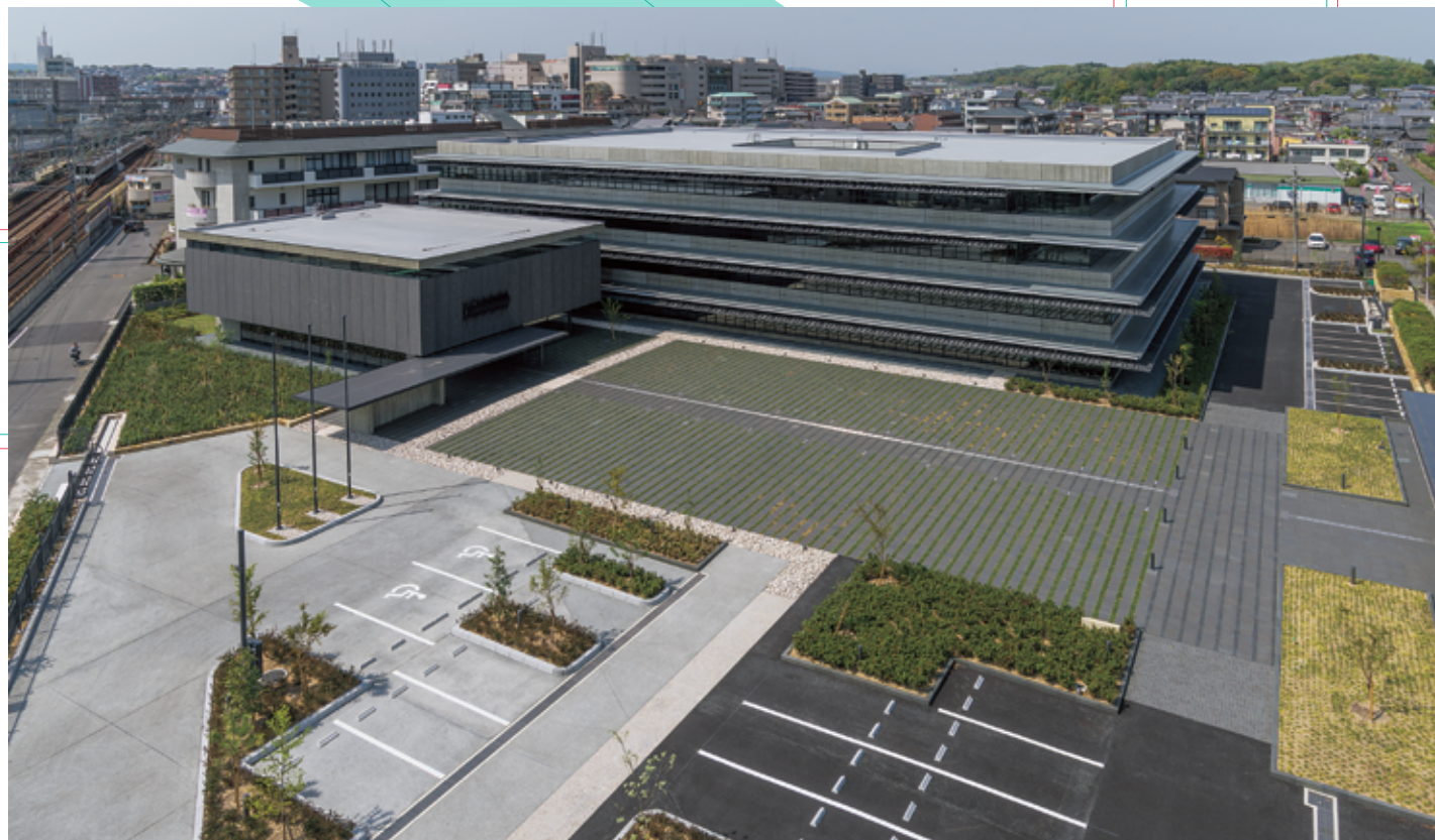
⑧ 本庁舎の敷地全景(南から)

奈文研本庁舎敷地の遺構表示 発行年：2018年 発行：独立行政法人 国立文化財機構 奈良文化財研究所 〒630-8577 奈良市二条町 2-9-1