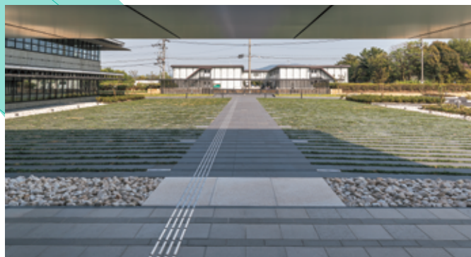
⑦ 庁舎エントランスより平城宮跡を望む