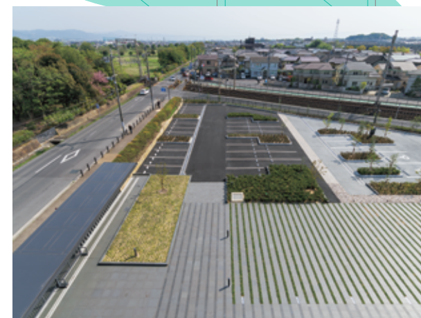
④ 西一坊大路跡 (北から)