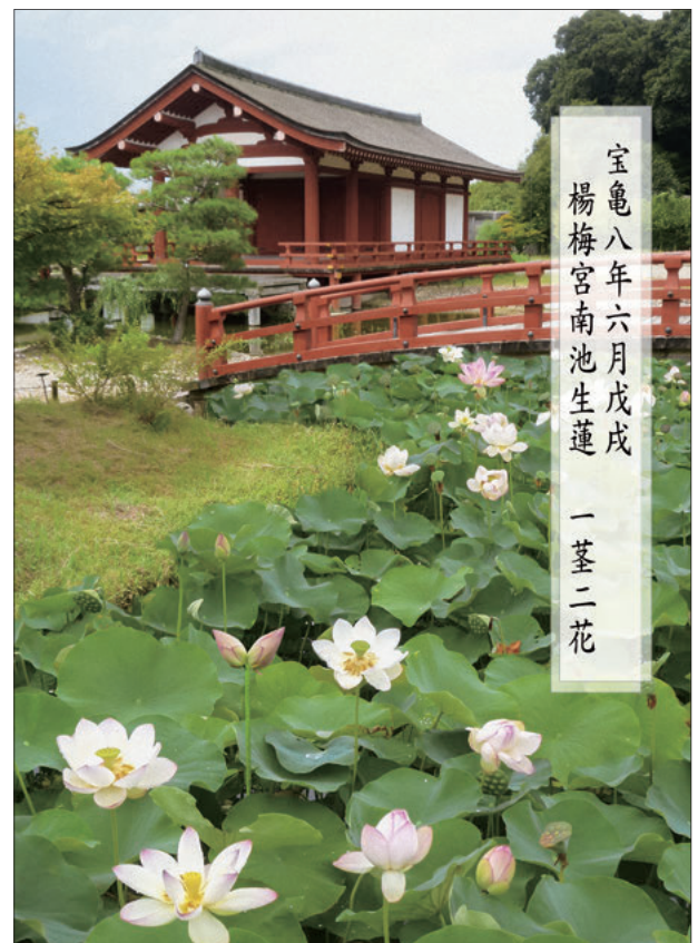
図2 双頭蓮の合成写真

この場所の庭園は『続日本紀』に一回だけ記載がある。奈良時代末期の光仁天皇の時代、宝亀8年6月18日に、楊梅宮南池に蓮が生じ、一つの茎に二つの花が咲いたという祥瑞の記事である。この当時、東院は楊梅宮と呼ばれており、反橋脇の入り江の池底のみが石敷きではないため、ここに蓮が植えられていたと考えられる。現地は遺構を露出した築山石組などがあり、盛土は最小限にしているため入江に根の深い蓮を植えることができずカキツバタなどを植栽している。このためミニ講演では祥瑞やその背景にある天人相関思想、奈良時代における祥瑞の政治的利用などの説明と合わせて、当時をイメージしてもらった合成写真を配布資料に加えた（図2）。合成写真の作成は記録と場としての遺跡を繋ぎ、価値をわかりやすく伝えるインタープリテーションの一