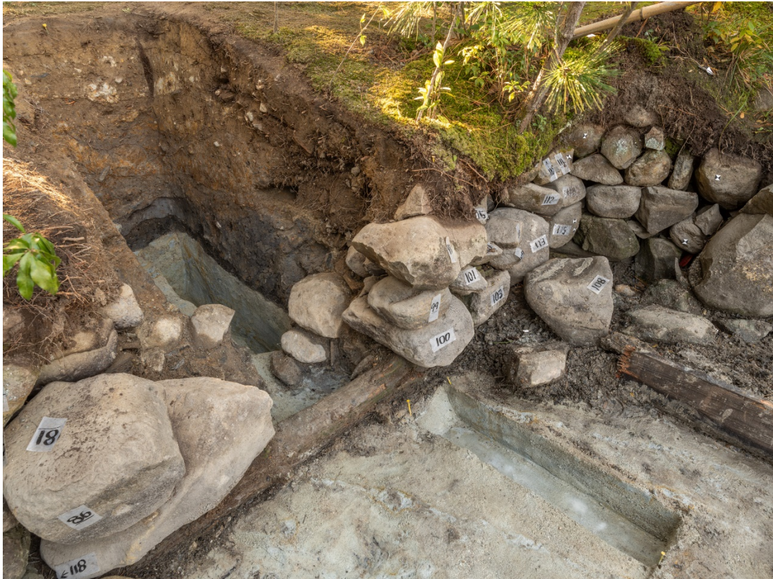
図2 1 トレンチ完掘状況 東から