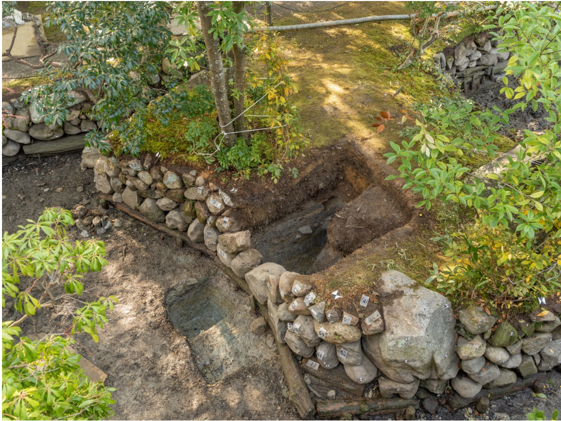
図4 2トレンチ完掘状況 北から