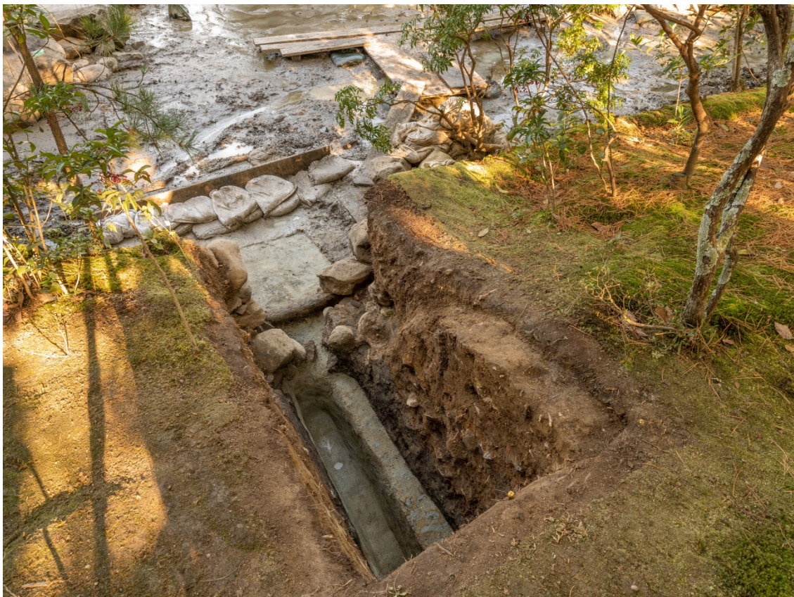
図3 1 トレンチ完掘状況 西から