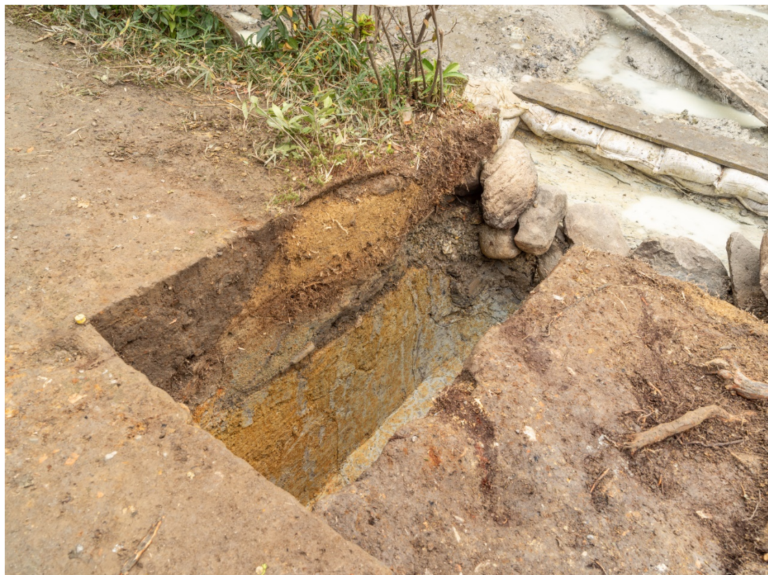
図5 3トレンチ完掘状況 北から