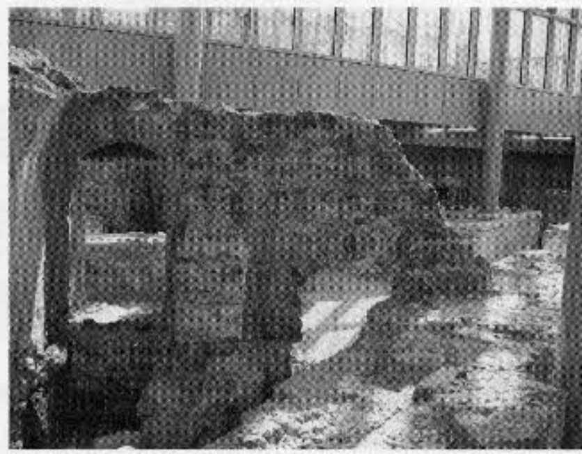
図24 旧家畜市場のテルメン遺跡