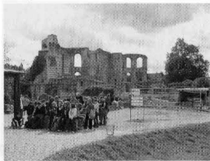
図22 カイザーズテルメン遺跡

トリアーの歴史の概要 ドイツ西部ラインプファルツ州の州都トリアーは、ルクセンブルグとの国境近く、フランス国境からも約50kmの距離に位置する。人口は約10万人。現在は一地方都市に過ぎないこの町は、BC15年頃にローマ皇帝アウグストゥスがライン川西岸地方の統治拠点としたことから、帝政ローマ時代を通じて現在のドイツで最大の都市であった。2世紀後半になると、この地方のローマ帝国の経営に対してゲルマン人の脅威が増大、その侵攻を防ぐため、AD180年頃には周囲に延長約6.4kmに及ぶ城壁が廻らされた。3世紀後半の一時期ゲルマン人により攻略されたものの、奪還後の復興が進んだコンスタンティヌス大帝統治下の4世紀初頭にはアルプス以北のキリスト教布教の拠点となって繁栄。同世紀には人口が6～8万人を数えた。西ローマ帝国が滅亡した5世紀末には人口が激減し衰亡。トリアー司教が大司教となった802年からは一時的に隆盛の気配を見せたものの、9世紀末にはヴァイキングによる破壊を被った。その後は徐々に復興し、14世紀には人口1万2千人まで回復、トリアー大司教は選帝侯の地位を得ることとなった。16世紀になると、織物業者たちが宗教改革を導入しようとしたが失敗して町から流出、このため都市の勢力は衰退した。17世紀前半の独仏間の30年戦争から18世紀初頭にかけては、フランス軍による包囲、占領、破壊が繰り返された。18世紀半ばにようやく落ち着きを取り戻し、バロック様式やロココ様式の教会・広場・庭園などが築造された。1794年にはフランス革命軍により占領、続いてフランスに併合された。1815年のナポレオン敗北後、プロシア領となる。第一次世界大戦では50回の爆撃を受け、戦後はフランス軍の進駐を受けた。さらに、第二次世界大戦では市街地の40%が破壊され、戦後の復興も遅々として進まなかった。しかし、復興時期の遅れがかえって歴史的遺産に対する意識の高まりと合致し、遺跡や歴史的建造物の修復や再建といった事業が積極的におこなわれ、二千年に及ぶ遺跡と歴史的建造物のショーケースと言われるようになった。これらのうち重要なものは州法によって保護の対象となり、さらに「トリアーのローマ遺跡、大聖堂、リープフラウエン教会」が世界