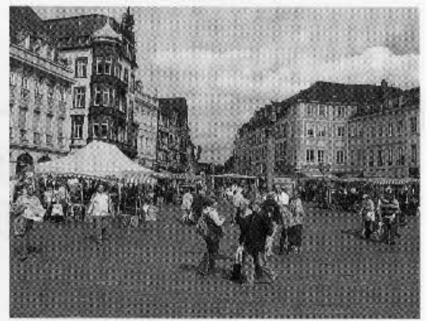
図25 観光者で賑うトリアー市街

されたため、破壊を免れた。教会として使われた期間、建物には幾多の改修が加えられたが、19世紀初頭トリアーを統治下においたナポレオンによってそうした後世の改修部分の多くが除去された。ポルタ・ニグラは「黒い門」を意味し、その名は石材が風化により黒色となった外観に由来する。トリアーの歴史を象徴する建造物であり、観光資源・学習資源として活用されている。